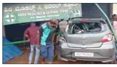
ದಾವಣಗೆರೆ, ಜು.17- ಚಾಲಕನ ನಿಯಂತ್ರಣ ತಪ್ಪಿದ ಕಾರಿನಿಂದ ಪಶುಗಳ ಔಷಧ ಅಂಗಡಿಗೆ ನುಗ್ಗಿದ ಕಾರು

ಅಂಗಡಿಗೆ ನುಗ್ಗಿರುವ ಫುಟನ್ ತಾಲ್ಲೂಕಿನ ತೋಳಹುಣಸೆ ಬಳಿ ಇಂದು ನಡೆದಿದೆ. ತೋಳಹುಣಸೆ ಬಳಿ ಸಾಗುತ್ತಿದ್ದ ಕಾರು ಚಾಲಕನ ನಿಯಂತ್ರಣ ತಪ್ಪಿ ಏಕಾಏಕಿ ಔಷಧ ಅಂಗಡಿಯತ್ತ ನುಗ್ಗಿದ. ಪರಿಣಾಮ ಅಂಗಡಿ ಮುಂಭಾಗದ ಕಬ್ಬಿಣದ ಮೇಲ್ದಾಣದ ಶೀಟಿಂಗ್ ಹಾನಿಯಾಗಿದೆ. ಕಾರಿನ ಮುಂಬದಿ ಮತ್ತು ಹಿಂಬದಿ ನಜ್ಜುಗಜ್ಜಾಗಿದೆ.