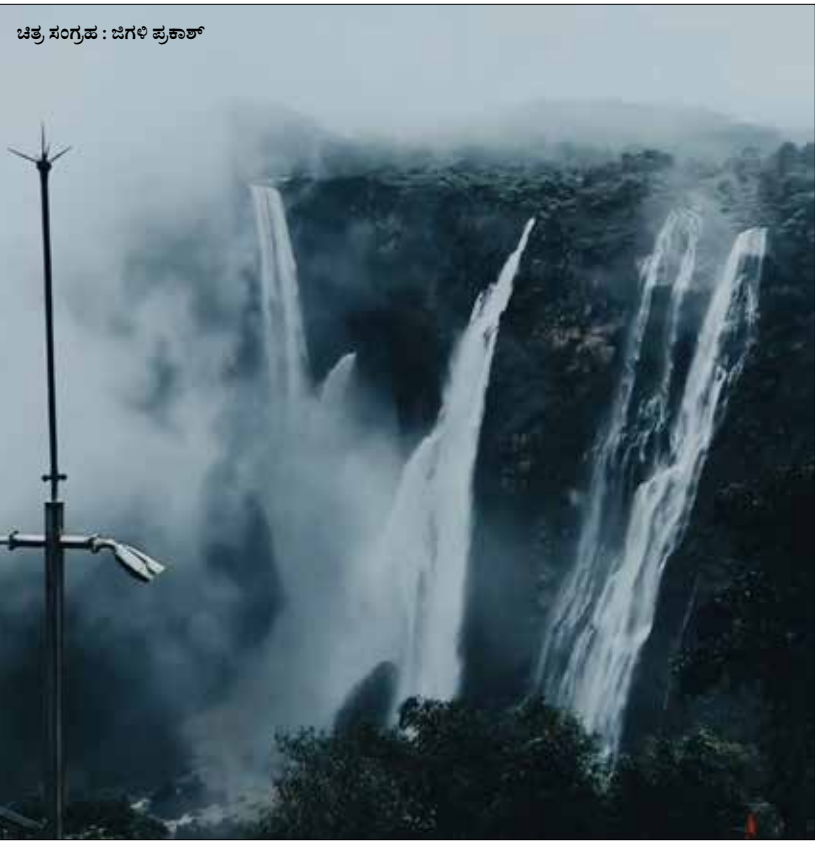
ಸತತ ಮಳೆಯಿಂದಾಗಿ ವಿಶ್ವ ವಿಖ್ಯಾತ ಜೋಗ ಜಲಪಾತದ ನಯನ ಮನೋಹರ ದೃಶ್ಯ ಪ್ರವಾಸಿಗರ ಕಣ್ಮನ ಸೆಳೆಯುತ್ತಿದೆ.