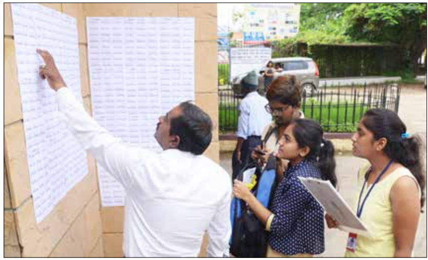
ವೈದ್ಯಕೀಯ ಪದವಿಗ ಪ್ರವೇಶ ಪಡೆಯಲು ಕಡ್ಡಾಯವಾಗಿರುವ ರಾಷ್ಟ್ರೀಯ ಅರ್ಹತೆ ಮತ್ತು ಪ್ರವೇಶ ಪರೀಕ್ಷೆ (ನೀಟ್) ಭಾನುವಾರ ದಾವಣಗೆರೆಯಲ್ಲಿ ನಡೆಯಿತು. ತಮ್ಮ ನೋಂದಣಿ ಸಂಖ್ಯೆ ಪರಿಶೀಲಿಸುತ್ತಿರುವ ಅಭ್ಯರ್ಥಿಗಳು

ಹರಿಹರ, ಜು. 17- ತುಂಗಭದ್ರಾ ನದಿಯ ನೀರಿನ ಹರಿವು ಹೆಚ್ಚಾದ ತಕ್ಷಣವೇ ಗಂಗಾನಗರದ ಸುಮಾರು 20 ಮನೆಗಳಿಗೆ ನೀರು ಸುಗ್ಗುವುದರಿಂದ ಅಲ್ಲಿನ ಹಾಗೂ ಬೆಂಕಿನಗರ ಬಡಾವಣೆಯ ನಿವಾಸಿಗಳಿಗೆ ಶಾಶ್ವತ ವ್ಯವಸ್ಥೆಗೆ ಶೀಘ್ರವೇ ಕ್ರಮ ತೆಗೆದುಕೊಳ್ಳಲಾಗುವುದು ಎಂದು ಜಿಲ್ಲಾಧಿಕಾರಿ ಶಿವಾನಂದ ಕಪಾಸಿ ಹೇಳಿದರು. ವಿವಿಧ ಆವರಣದ ಕಾಳಜಿ ಕೇಂದ್ರ, ಗಂಗಾನಗರ ಹಾಗೂ ಬೆಂಕಿನಗರದ ಚಾನಲ್ ವೀಕ್ಷಣೆ ಮಾಡಿದ ನಂತರ ಪತ್ತೆಕರ್ತರೊಂದಿಗೆ ಅವರು ಮಾತನಾಡಿದರು. ಗಂಗಾನಗರ ನಿವಾಸಿಗಳು ವಾಸಿಸುತ್ತಿರುವ ಸ್ಥಳ ಹಿಡಬ್ಬೂಡಿ ಇಲಾಖೆಯ ರಸ್ತೆಗೆ ನಿಗದಿಪಡಿಸಿರುವ ಸ್ಥಳ ವಿಸ್ತರಿಸಲಾಗಿದೆ. ಅಲ್ಲಿನ 15 ರಿಂದ 20 ಮನೆಗಳಿಗೆ ಮಾತ್ರ ತೊಂದರೆ ಆಗುತ್ತಿದೆ. ಅಲ್ಲಿನವರಿಗೆ ಸ್ವಂ ಬೋರ್ಡ್ ವತಿಯಿಂದ ವಸತಿಗೆ ವ್ಯವಸ್ಥೆ ಮಾಡಲಾಗುವುದು. ಜಿಲ್ಲಾಧಿಕಾರಿ ಶಿವಾನಂದ ಕಪಾಸಿ ನಂತರದಲ್ಲಿ ಪ್ರವಾಹ ಪೀಡಿತ ಪ್ರದೇಶದಲ್ಲಿ ಯಾರೂ ಮನೆ ಕಟ್ಟಿಕೊಳ್ಳದಂತೆ ಆ ಸ್ಥಳವನ್ನು ನಗರಸಭೆಯ ವ್ಯಾಪ್ತಿಗೆ ತರಲಾಗುವುದು ಎಂದು ಜಿಲ್ಲಾಧಿಕಾರಿ ತಿಳಿಸಿದರು. ಬೆಂಕಿನಗರ ಬಡಾವಣೆಯ ನಿವಾಸಿಗಳ ಸಮಸ್ಯೆ ತಕ್ಷಣವೇ ಆಗುವಂತಹ ಕಾರ್ಯವಲ್ಲ. ಇದಕ್ಕೊಂದು ಶಾಶ್ವತ ಪರಿಹಾರ ಕಂಡುಕೊಳ್ಳಲು ವಿವಿಧ ಇಲಾಖೆಯ ಅಧಿಕಾರಿಗಳ ಬಳಿ ಸಮಗ್ರವಾಗಿ ಚರ್ಚೆ ಮಾಡಿ ಕ್ರಮ ತೆಗೆದುಕೊಳ್ಳಲಾಗುವುದು ಎಂದವರು ಹೇಳಿದರು. ಮುಂದಿನ ದಿನಗಳಲ್ಲಿ ನಗರದಲ್ಲಿನ ಜ್ವಲಂತ ಸಮಸ್ಯೆಗಳಾದ ಯುಜಿಡಿ, ಜಲಸಿರಿ ಯೋಜನೆ, ರಸ್ತೆಗಳ ದುರಸ್ತಿ, ಸ್ವಚ್ಛತೆ, ಆರೋಗ್ಯ, ಟ್ರಾಫಿಕ್, ವಿದ್ಯುತ್ ಸೇರಿದಂತೆ, ಹಲವು ಸಮಸ್ಯೆಗಳಿಗೆ ಪರಿಹಾರ ಕಂಡುಕೊಳ್ಳಲಾಗುವುದು. ತಾಲ್ಲೂಕಿನ ಸಾರಥಿ ಮತ್ತು ಚಿಕ್ಕಬಿದರಿ ಮತ್ತು ಕಡರನಾಯಕನ (3ನೇ ಪುಟಕ್ಕೆ)