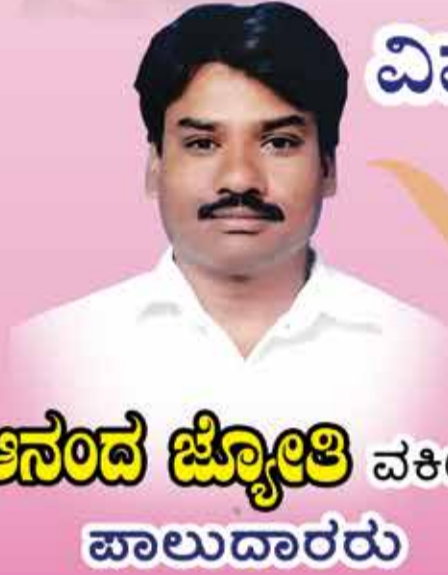
ಆನಂದ ಜ್ಯೋತಿ ವಕೀಲರು ಪಾಲುದಾರರು