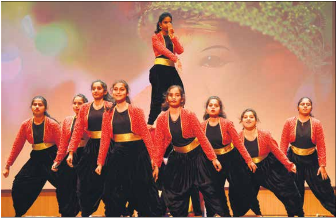
ನಮ್ಮ ದವಸದಲ್ಲಿ ಗಣಪತಿ ಸ್ತುತಿ ದಾವಣಗೆರೆ, ಜೂ. 24- ನಗರದ ಬಾಪೂಜಿ ಇಂಜಿನಿಯರಿಂಗ್ ಮತ್ತು ತಾಂತ್ರಿಕ ಮಹಾವಿದ್ಯಾಲಯದ 'ನಮ್ಮ ದವಸ' ಕಾರ್ಯಕ್ರಮದಲ್ಲಿ ವಿದ್ಯಾರ್ಥಿನಿಯರು ಗಣಪತಿ ಸ್ತುತಿಸುವ ಮನಮೋಹಕ ನೃತ್ಯವನ್ನು ಪ್ರಸ್ತುತಪಡಿಸಿದರು.