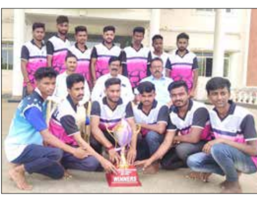
ರಾಣೇಬೆನ್ನೂರು : ಎಸ್.ಟಿ.ಜಿ ತಂಡ ಪ್ರಥಮ ರಾಣೇಬೆನ್ನೂರು, ಜೂ.24- ಹಳೆಯಾಳದಲ್ಲಿ ನಡೆದ ಬೆಳಗಾವಿ ಇಂಟರ್‌ಜೋನ್‌ಹುದುಗರ ಬೋರ್ಡ್‌ನ ಸ್ಪರ್ಧೆಯಲ್ಲಿ ರಾಣೇಬೆನ್ನೂರು ಶ್ರೀ ತರಳಬಾಳು ಜಗದ್ಗುರು ವಿದ್ಯಾಸಂಸ್ಥೆಯ ತಾಂತ್ರಿಕ ಮಹಾವಿದ್ಯಾಲಯದ ಹುಡುಗರು ಪ್ರಥಮ ಸ್ಥಾನ ಗಳಿಸಿದ್ದಾರೆ.