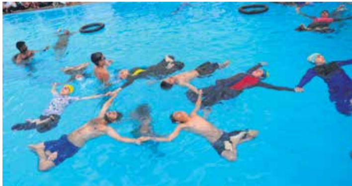
ದಾವಣಗೆರೆ ಅಪೀಸರ್ಸ್ ಕ್ಲಬ್‌ನ ಈಜುಕೊಳದಲ್ಲಿ ಯೋಗ ಪಟುಗಳಿಂದ ಜಲಯೋಗ