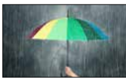
ಅಂಡಮಾನ್‌ನಲ್ಲಿ ಮೇ 15ರಂದು ಮೊದಲ ಮಳೆ

ನವದೆಹಲಿ, ಮೇ 12 - ಅವಧಿಗೆ ಮೊದಲೇ ಮುಂಗಾರು ಅಂಡಮಾನ್ ಮತ್ತು ನಿಕೋಬಾರ್ ದ್ವೀಪಗಳಿಗೆ ಬರಲಿದೆ. ಮೇ 15ರಂದು ದ್ವೀಪಗಳಲ್ಲಿ ಮೊದಲ ಮುಂಗಾರು ಮಳೆಯಾಗಲಿದೆ ಎಂದು ಹವಾಮಾನ ಇಲಾಖೆಯ ಪ್ರಕಟಣೆಯಲ್ಲಿ ತಿಳಿಸಲಾಗಿದೆ.