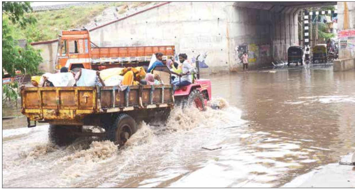
ಕಳೆದ ಮೂರ್ತಿಯಲ್ಲಿ ಉತ್ತಮ ಮಳೆಯಾಯಿತು. ಎಪಿಸೋಡ್ ಮಾರುಕಟ್ಟೆ ಬಳಿಯ ಕೆಳಗೆ ಸೇರಿರುವ ಬಳಿ ನಿಂತು ನೀರಿನಲ್ಲಿಯೇ ಟ್ರ್ಯಾಕ್ಟರ್ ಚಲಿಸುತ್ತಿರುವುದು.