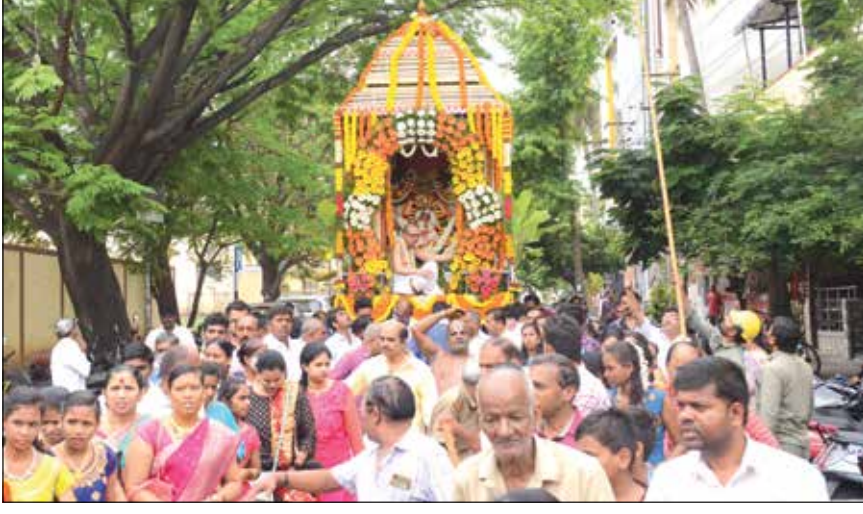
ಶ್ರೀ ಲಕ್ಷ್ಮಿ ವೆಂಕಟೇಶ್ವರ ಸ್ವಾಮಿ ಬ್ರಹ್ಮರಥೋತ್ಸವ

ದಾವಣಗೆರೆ ಎಂ.ಸಿ.ಸಿ. 'ಬಿ' ಬ್ಲಾಕ್‌ನಲ್ಲಿರುವ ಶ್ರೀ ಲಕ್ಷ್ಮಿ ವೆಂಕಟೇಶ್ವರ ಸ್ವಾಮಿ ದೇವಸ್ಥಾನದಲ್ಲಿ ದೇವಸ್ಥಾನದ ಶ್ರೀ ಸ್ವಾಮಿಯು 23ನೇ ವರ್ಷದ ಬ್ರಹ್ಮರಥೋತ್ಸವವು ಬುಧವಾರ ವಿಜೃಂಭಣೆಯಿಂದ ಜರುಗಿತು.