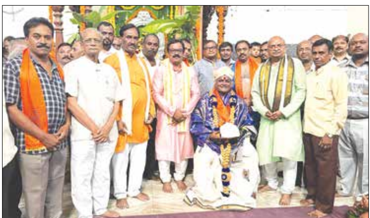
ನಗರದಲ್ಲಿ ಸಂಭ್ರಮದ ವಾಸವಿ ಜಯಂತಿ