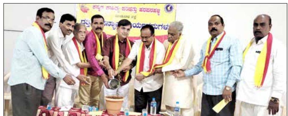
ಕಲಾವಿದರಿಗೆ ವಿಶೇಷ ಉಲ್ಲಾಸಗಳನ್ನು ನೀಡಿದ ಜನಪದ ಘಟಕದ ಅಧ್ಯಕ್ಷರು.

ರೈತರು, ಕಾರ್ಮಿಕರು, ಶ್ರಮಿಕ ವರ್ಗದವರು ಸೇರಿದಂತೆ ಎಲ್ಲಾ ವರ್ಗದ ಕಾರ್ಯ ಮಾಡುವವರಲ್ಲಿಯೂ ಜನಪದ ಸಾಹಿತ್ಯ ಹಾಸು ಹೊಕ್ಕಾಗಿದೆ. ಜನಪದದಲ್ಲಿ ನೈತಿಕ ಮೌಲ್ಯಗಳಿವೆ. ಬೀಸುವಾಗ, ಕುಟ್ಟುವಾಗ ಬೆಳೆ ಕೊಯ್ಯುವಾಗ, ಜನಪದ ಬಾಯಿಂದ ಬಾಯಿಗೆ ಹಾಡುತ್ತ ಬಂದಿರೂ ಕೂಡ ಸಾಕಷ್ಟು ಸಾಹಿತ್ಯ ಬರಹದಲ್ಲಿ ಸಿಗದೆ ಇರುವುದು ದುರಂತದ ಸಂಗತಿ. ಸರ್ಕಾರ ಜನಪದ