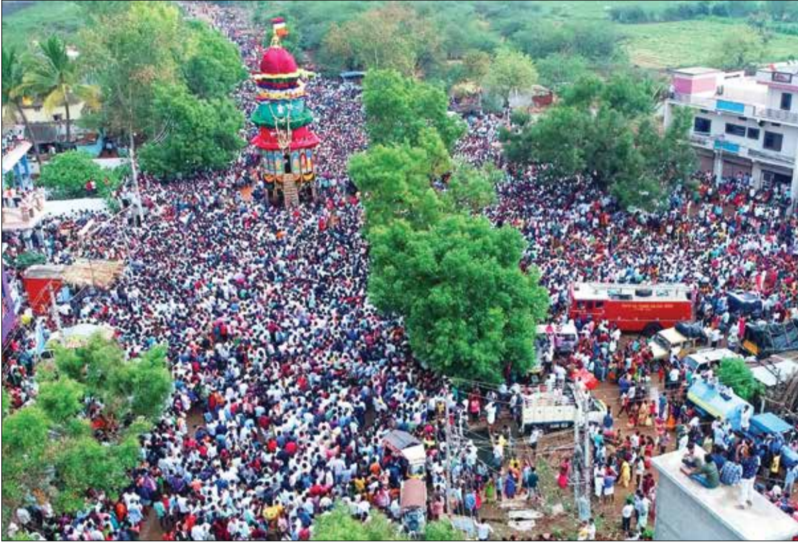
ಉಜ್ಜಯಿನಿ ತೇರು ಕೊಟ್ಟು ತಾಲ್ಲೂಕು ಉಜ್ಜಯಿನಿ ಶ್ರೀ ಮರುಳಸಿದ್ದೇಶ್ವರ ಸ್ವಾಮಿ ಮಹಾರಾಜರೋತ್ಸವವು ಶುಕ್ರವಾರ ಸಂಜೆ ಅಪಾರ ಭಕ್ತರ ಸಮೂಹದಲ್ಲಿ ಆದ್ಯಂತಿಯಾಗಿ ನೆರವೇರಿತು. ಇಂದು ದೇವಾಲಯದ ಗೋಪುರದ ಶಿಖರಕ್ಕೆ ತೈಲಾಭಿಷೇಕ ನಡೆಯಲಿದೆ.