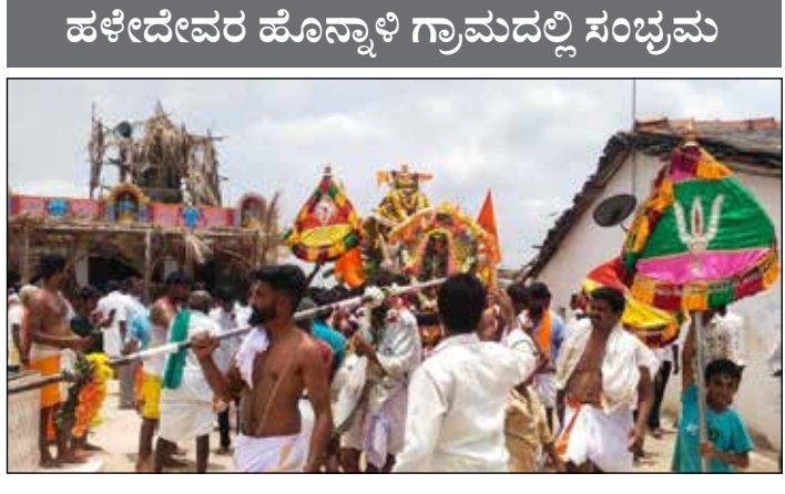
ಅವರಣದಿಂದ ಶ್ರೀ ಮಾಧವ ರಂಗನಾಥ ಅಲಿಂದ ಪುನಃ ಶ್ರೀ ರಾಮಾನುಜಾಚಾರ್ಯರ ಸ್ವಾಮಿ ದೇವಸ್ಥಾನದವರೆಗೆ ಸಂಚರಿಸಿತು. ಮಠದ ಆವರಣಕ್ಕೆ ಬಂದು ತಲುಪಿತು.

ಹೊನ್ನಾಳಿ, ಮೇ 5 - ತಾಲ್ಲೂಕಿನ ಹಳೇದೇವರ ಹೊನ್ನಾಳಿ ಗ್ರಾಮದ ಭಗವಾನ್ ಶ್ರೀ ರಾಮಾನುಜಾಚಾರ್ಯರ ಮಠದಲ್ಲಿ ಗುರುವಾರ ಭಗವಾನ್ ಶ್ರೀ ರಾಮಾನುಜಾಚಾರ್ಯರ 1005ನೇ ಜಯಂತಿಯನ್ನು ಸಮಾರಂಭ, ಆಚಾರ್ಯರ ಶ್ರೀ ರಾಮಾನುಜಾಚಾರ್ಯರ ನೂತನ ರಥೋತ್ಸವ ವೈಭವದಿಂದ ನೆರವೇರಿತು.