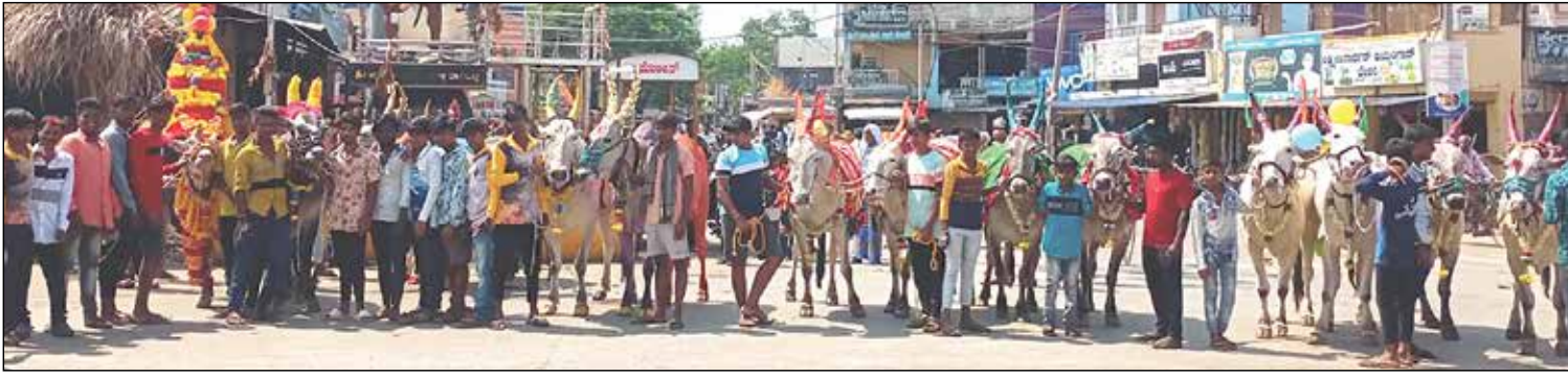
ಹೊನ್ನಾಳಿಯಲ್ಲಿ ಎತ್ತುಗಳ ಮೆರವಣಿಗೆ ವಿಶ್ವಗುರು ಶ್ರೀ ಬಸವೇಶ್ವರ ಜಯಂತೋತ್ಸವ ಸಮಾರಂಭದ ಪ್ರಯುಕ್ತ ಅಲಂಕೃತ ಎತ್ತುಗಳ ಮೆರವಣಿಗೆ ನಡೆಸಲಾಯಿತು. ಯುವಕರು - ಮಕ್ಕಳು ಪಟ್ಟಣದ ಕ್ರಾಂತಿವೀರ ಸಂಗೊಳ್ಳಿ ರಾಯಣ್ಣ ವೃತ್ತದಲ್ಲಿ ಎತ್ತುಗಳೊಂದಿಗೆ ಸಂಭ್ರಮಿಸಿದರು.