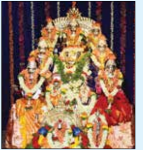
ದಾವಣಗೆರೆ ಕಾಯಿಪೇಟೆ ಹಾಗೂ ಬಸವೇಶ್ವರ ದೇವಸ್ಥಾನಗಳಲ್ಲಿ ವಿಶೇಷ ಪೂಜೆ ನಡೆಯಿತು.

ದಾವಣಗೆರೆ, ಮೇ 3 - ವಿಶ್ವಗುರು ಬಸವಣ್ಣನವರ ಜಯಂತಿ ಯನ್ನು ನಗರದಲ್ಲಿ ಉತ್ಸವವಾಗಿ ಸಂಭ್ರಮದಿಂದ ಆಚರಿಸಲಾಯಿತು. ನಗರದ ಬಸವೇಶ್ವರ ದೇವಾಲಯಗಳಲ್ಲಿ ಬಸವ ಜಯಂತಿ ಪ್ರಯುಕ್ತ ಹೊರ ಹಾಗೂ ಒಳ ಆವರಣವು ವಿಶೇಷ ಪುಷ್ಪಾಲಂಕಾರದಿಂದ ಕಂಗೊಳಿಸುತ್ತಿದ್ದವು. ವಿಶೇಷ ಪೂಜೆಗಳು ನಡೆದವು. ಬಸವಣ್ಣನ ಭಕ್ತ ಸಮೂಹ ಬಸವೇಶ್ವರರನ್ನು ಆರಾಧಿಸಿದರು. ನಗರದ ಕಾಯಿಪೇಟೆ, ದೊಡ್ಡ ಪೇಟೆ ಮತ್ತು ಬಸವರಾಜ ಪೇಟೆಯಲ್ಲಿರುವ ಬಸವೇಶ್ವರ ದೇವಾಲಯಗಳಲ್ಲಿ ವಿಶೇಷ ಪೂಜಾ ಕೈಂಕರ್ಯಗಳು ಜರುಗಿದವು. ಬೆಳಿಗ್ಗೆ ಯಿಂದಲೇ ಬಸವೇಶ್ವರ ದೇವಾಲಯಗಳಿಗೆ ಭಕ್ತರು ಕುಟುಂಬ ಸಮೇತ ರಾಗಿ ತೆರಳಿ ಪೂಜೆ ಸಲ್ಲಿಸಿದರು. ಕೆಲ ಭಕ್ತರು ಸಿಹಿ ಸಮಯೊಟವನ್ನು ಬಸವೇಶ್ವರ ದೇವರಿಗೆ ನೈವೇದ್ಯ ಸಮರ್ಪಿಸಿದರು. ಕಾಯಿಪೇಟೆ, ದೊಡ್ಡಪೇಟೆ ಮತ್ತು ಬಸವರಾಜ ಪೇಟೆಯಲ್ಲಿನ ಬಸವೇಶ್ವರ ದೇವಾಲಯಗಳಲ್ಲಿ ಜನರ ಸಂಖ್ಯೆ ಹೆಚ್ಚಾಗಿತ್ತು. ಕಾಯಿಪೇಟೆಯ ಬಸವೇಶ್ವರ ದೇವಾಲಯದಲ್ಲಿ (2ನೇ ಪುಟಕ್ಕೆ)