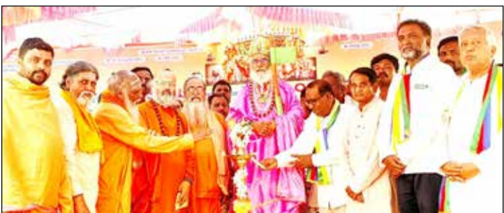
ಭಾವನೆಗಳು ಬೆಳೆಯುತ್ತಿಲ್ಲ. ಧರ್ಮಕ್ಷೇತ್ರ ವಾತಾವರಣ ನಿರ್ಮಾಣ ಗೊಳುತ್ತಿರುವುದು ಮೊದಲನೆಯದು ಎಲ್ಲಾ ರಂಗಗಳಲ್ಲಿ ಕಲುಷಿತ ಆರೋಗ್ಯಕರ ಸಮಾಜಕ್ಕೆ ಮಾರಕವಾಗಿದೆ.