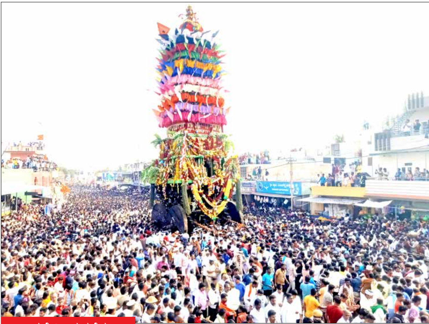
ವಿಜಯಭಕ್ತಿಯಿಂದ ನಡೆದ ನಾಯಕನಹಟ್ಟಿ ಶ್ರೀ ಗುರು ತಿಪ್ಪೇರುದ್ರಸ್ವಾಮಿ ರಥೋತ್ಸವ

ಸಂಪುಟ : 48 ಸಂಚಿಕೆ : 310 ಫೋನ್ : 254736 91642 99999 RNI No: 27369/75 KA/SK/CTA-275/2021-2023. O/P @ B.V. Nagar P.O. ಪುಟ : 4 ರೂ : 4.00 www.janathavani.com janathavani@mac.com