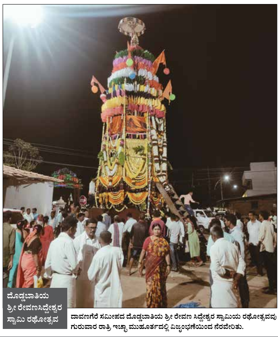
ದೊಡ್ಡಬಾತಿಯ ಶ್ರೀ ರೇವಣಸಿದ್ದೇಶ್ವರ ಸ್ವಾಮಿ ರಥೋತ್ಸವ

ದಾವಣಗೆರೆ ಸಮೀಪದ ದೊಡ್ಡಬಾತಿಯ ಶ್ರೀ ರೇವಣ ಸಿದ್ದೇಶ್ವರ ಸ್ವಾಮಿಯ ರಥೋತ್ಸವವು ಗುರುವಾರ ರಾತ್ರಿ ಇಷ್ಟಾ ಮುಹೂರ್ತದಲ್ಲಿ ವಿಧ್ಯುಭವಿಯಿಂದ ನೆರವೇರಿತು.