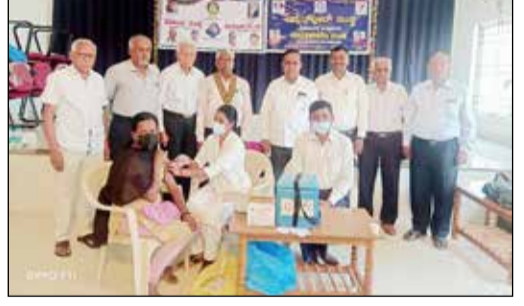
ದಾವಣಗೆರೆ, ಮಾರ್ಚ್ 9- ರೋಟರಿ ಸಂಸ್ಥೆ ವಿದ್ಯಾನಗರ ಇಲ್ಲಿ ಕೋವಿಶೀಲ್ಡ್ ಮತ್ತು ಬೂಸ್ಟರ್ ಲಸಿಕೆ ಹಾಕಿಸಲಾಯಿತು.