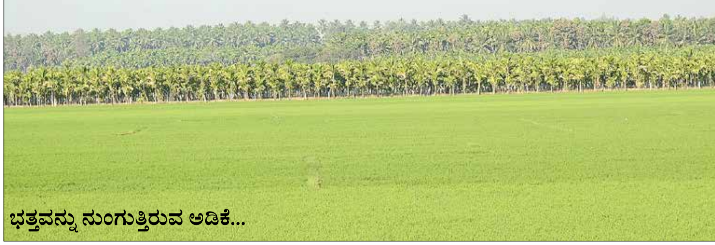
ಭತ್ತವನ್ನು ನುಂಗುತ್ತಿರುವ ಅಡಿಕೆ...