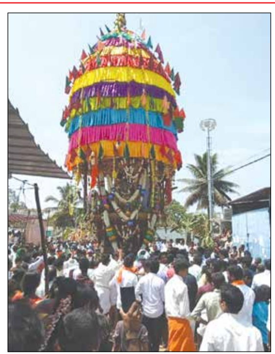
ಬಲ್ಲೂರಿನಲ್ಲಿ ವಿಜೃಂಭಣೆಯ ರಥೋತ್ಸವ