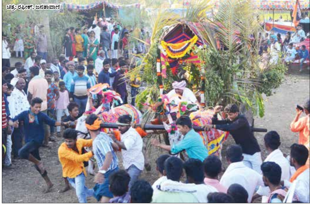
ಬೆಲ್ಲದ ಬಂಡಿ .. ದಾವಣಗೆರೆ ತಾಲ್ಲೂಕು ದೇವರಹಳ್ಳಿ ಗ್ರಾಮದ ಶ್ರೀ ದೇವರಹಳ್ಳಿ ಬಸವಣ್ಣನ ರಥೋತ್ಸವದ ಅಂಗವಾಗಿ ಮಂಗಳವಾರ ಸಂಜೆ ಬೆಲ್ಲದ ಬಂಡಿ ಹಾಗೂ ಹೋರಿಗಳ ಮೆರವಣಿಗೆ ನಡೆಯಿತು.