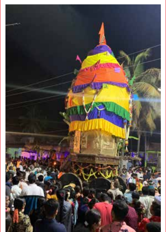
ನಂದಿತಾವರೆಯಲ್ಲಿ ರಥೋತ್ಸವ ಮಲೇಬೆನ್ನೂರು ಸಮೀಪದ ನಂದಿತಾವರ ಗ್ರಾಮದ ಶ್ರೀ ಬಸವೇಶ್ವರ ಸ್ವಾಮಿಯ ಮಹಾರಥೋತ್ಸವ ಶನಿವಾರ ತಡರಾತ್ರಿ ಸಂಭ್ರಮದಿಂದ ಜರುಗಿತು.