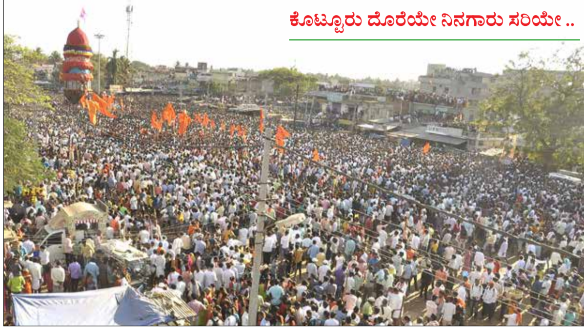
ಕೊಟ್ಟೂರು ದೊರೆಯೇ ನಿನಗಾರು ಸರಿಯೇ ..

ಕೊಟ್ಟೂರು (ವಿಜಯನಗರ ಜಿಲ್ಲೆ) ಪಟ್ಟಣದ ಆರಾಧ್ಯದೇವ ಕೊಟ್ಟೂರೇಶ್ವರ ಸ್ವಾಮಿಯ ರಥೋತ್ಸವವು ಶುಕ್ರವಾರ ಸಂಜೆ ಸಹಸ್ರಾರು ಭಕ್ತರ ಸಮ್ಮುಖದಲ್ಲಿ ಸಂಭ್ರಮದಿಂದ ನೆರವೇರಿತು. ಶುಕ್ರವಾರ ಬೆಳಿಗಿನ ಜಾವ ದೇವಸ್ಥಾನದಲ್ಲಿ ಪೂಜಾ ಕೈಕಾರ್ಯಗಳು ಜರುಗಿದವು. ಸಂಜೆ ಸ್ವಾಮಿಯನ್ನು ದೇವಸ್ಥಾನದಿಂದ ರಥದವರೆಗೆ ಸಕಲ ವಾದ್ಯ ಮೇಳಗಳೊಂದಿಗೆ ಮರವಣಿಗೆಯಲ್ಲಿ ಕೊಂಡೊಯ್ದು ರಥಕ್ಕೆ ಪ್ರದಕ್ಷಿಣೆ ಹಾಕಿ ಪ್ರತಿಷ್ಠಾಪಿಸಲಾಯಿತು. ಬಳಿಕ ಭಕ್ತರು ತೇರು ಎಳೆದರು.