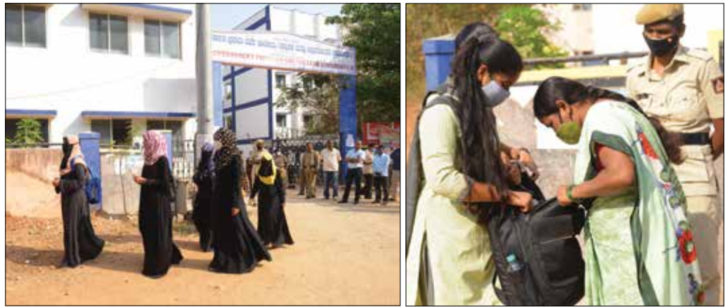
ದಾವಣಗೆರೆ ಸರ್ಕಾರಿ ಪ್ರಥಮ ದರ್ಜೆ ಕಾಲೇಜಿನಲ್ಲಿ ಹಿಜಾಬ್ ತೆಗೆಯಲು ಒಪ್ಪದೇ ವಾಪಸ್ಸಾಗುತ್ತಿರುವ ವಿದ್ಯಾರ್ಥಿನಿಯರು. ಮೊಬೈಲ್ ನಿಷೇಧ ಹಿನ್ನೆಲೆಯಲ್ಲಿ ವಿದ್ಯಾರ್ಥಿನಿಯೊಬ್ಬರ ಬ್ಯಾಗ್ ಪರಿಶೀಲಿಸುತ್ತಿರುವ ಕಾಲೇಜು ಸಿಬ್ಬಂದಿ (ಬಲಚಿತ್ರ)

ದಾವಣಗೆರೆ, ಫೆ.16 - ಹಿಜಾಬ್ ಹಾಗೂ ಕೇಸರಿ ಶಾಲು ವಿವಾದದಿಂದಾಗಿ ರಜೆ ಘೋಷಿಸಲಾಗಿದ್ದ ಪಿಯುಸಿ ಹಾಗೂ ಪ್ರಥಮ ದರ್ಜೆ ಕಾಲೇಜುಗಳು ಇಂದು ಪುನರಾರಂಭಗೊಂಡಿವೆ. ಧಾರ್ಮಿಕ ಸಂಕೇತದ ಬಟ್ಟೆಗಳನ್ನು ವಿದ್ಯಾರ್ಥಿಗಳು ಧರಿಸುವಂತಿಲ್ಲ ಎಂಬ ಹೈ ಕೋರ್ಟ್ ಮಧ್ಯಂತರ ಆದೇಶದ ಹೊರತಾಗಿಯೂ ವಿದ್ಯಾರ್ಥಿನಿಯರು ಹಿಜಾಬ್ ಧರಿಸಿ ಕಾಲೇಜಿಗೆ ಆಗಮಿಸಿದ್ದರು. ಹಿಜಾಬ್ ಧರಿಸುವಂತಿಲ್ಲ ಎಂಬ ಆಧ್ಯಾಪಕರು, ಅಧಿಕಾರಿಗಳ ಮನವಿಗೆ ಕೆಲ ವಿದ್ಯಾರ್ಥಿನಿಯರು ಹಿಜಾಬ್ ತೆಗೆದು ಕಾಲೇಜು ಪ್ರವೇಶಿಸಿದರೆ, ಮತ್ತೆ ಕೆಲವರು ಹಿಜಾಬ್ ತೆಗೆಯಲು ನಿರಾಕರಿಸಿ, ನಮಗೆ ಹಿಜಾಬ್ ಮುಖ್ಯ ಎಂದು ಕಾಲೇಜಿನಿಂದ ಹೊರ ನಡೆದರು. ನಗರದ ಸರ್ಕಾರಿ ಪ್ರಥಮ ದರ್ಜೆ ಕಾಲೇಜು, ರಾಜನಹಳ್ಳಿ ಸೀತಮ್ಮ ಬಾಲಕಿಯರ ಸರ್ಕಾರಿ ಪಿಯು ಕಾಲೇಜು, ಮೋತಿ ವೀರಪ್ಪ ಕಾಲೇಜು ಸಹಿತ ವಿವಿಧ ಕಾಲೇಜುಗಳಲ್ಲಿ ಸಾವಿರಾರು ವಿದ್ಯಾರ್ಥಿನಿಯರು ತರಗತಿಗೆ ಹಾಜರಾದರೆ, ಹಿಜಾಬ್ ಧರಿಸಿ ಬಂದ ಹಲವರು ಮನವೊಲಿಕೆಗೆ ಬಗ್ಗದೆ ವಾಪಸ್ ತೆರಳಿದರು. ಸರ್ಕಾರಿ ಪ್ರಥಮ ದರ್ಜೆ ಕಾಲೇಜಿನ ಕೆಲ (2ನೇ ಪುಟಕ್ಕೆ)