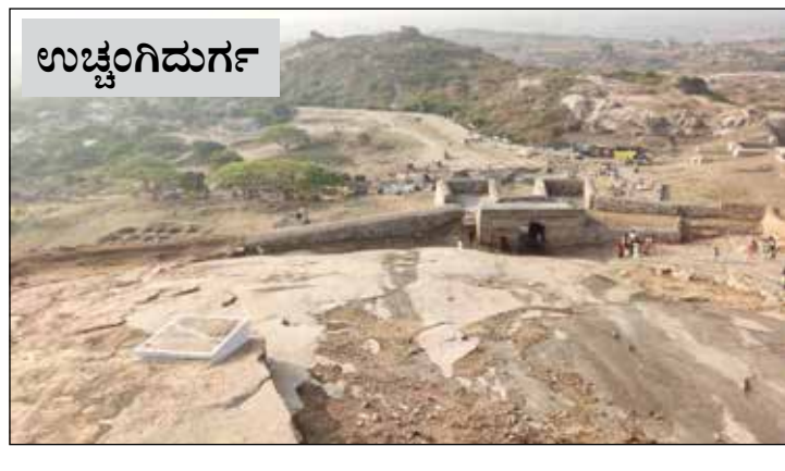
ಉಚ್ಚೇರಿಮು ದೇವಿ ಸನ್ನಿಧಿಯಲ್ಲಿ ಭರತ ಹುಣ್ಣಿಮೆ ಆಚರಣೆ ನಡೆಯುತ್ತಿದೆ.

ಹರಹನಹಳ್ಳಿ, ಫೆ.16- ಮಧ್ಯ ಕರ್ನಾಟಕದ ಐತಿಹಾಸಿಕ ಉಚ್ಚೇರಿಮು ದೇವಿ ಸನ್ನಿಧಿಯಲ್ಲಿ ಈ ಬಾರಿಯ ಭರತ ಹುಣ್ಣಿಮೆಗೆ ಗ್ರಾಮಸ್ಥರನ್ನು ಹೊರತುಪಡಿಸಿ ಹೊರಗಿನ ಭಕ್ತರ ಸಂಖ್ಯೆ ವಿರಳ ವಾಗಿತ್ತು ರಾಜ್ಯದ ಅಲ್ಲಲ್ಲಿ ಸೋಂಕು ಉಲ್ಬಾಣ ಗೊಂಡ ಹಿನ್ನೆಲೆಯಲ್ಲಿ ಜಿಲ್ಲಾಧಿಕಾರಿಗಳ ಆದೇಶದಂತೆ ಕೇವಲ ದೇವಿಯ ಪೂಜಾ ಕಾರ್ಯಕ್ರಮಗಳನ್ನು ಹೊರತು ಪಡಿಸಿ ಮುಂಜಾಗ್ರತಾ ಕ್ರಮವಾಗಿ ಐತಿಹಾಸಿಕ ಭರತ ಹುಣ್ಣಿಮೆ ಆಚರಣೆಯನ್ನು ಸ್ಥಳೀಯರಿಗೆ ಮಾತ್ರ ಸೀಮಿತಗೊಳಿಸಲಾಗಿತ್ತು. ಗ್ರಾಮದ ಸುತ್ತ ಮುತ್ತ ಜನ ಎತ್ತಿನಗಾಡಿ ಟ್ರಾಕ್ಟರ್ ಸೇರಿದಂತೆ ಯಾವುದೇ ವಾಹನಗಳ ಮೂಲಕ ಕ್ಷೇತ್ರಕ್ಕೆ ಬರದಂತೆ ಬಿಗಿ ಕ್ರಮ ಕೈಗೊಳ್ಳಲಾಗಿತ್ತು. ಈ ನಿಟ್ಟಿನಲ್ಲಿ ಜಿಲ್ಲಾಡಳಿತ ಹಾಗೂ ತಾಲ್ಲೂಕು ಆಡಳಿತ ಬಿಗಿ ಪೊಲೀಸ್ ಬಂದೋಬಸ್ತು ಮಾಡಲಾಗಿದ್ದು, ಹೊರಗಿನ ಭಕ್ತರ ಅಲ್ಲೇ ಪೂಜೆ ಮುಗಿಸಿ ತಮ್ಮ ಊರುಗಳಿಗೆ ತೆರಳಿದರು. ಗ್ರಾಮದ ಸುತ್ತಮುತ್ತಲಿನ ಭಕ್ತರಿಗೆ ದೇವಸ್ಥಾನದಲ್ಲಿ ಎಂದಿನಂತೆ ನಡೆಯುವ