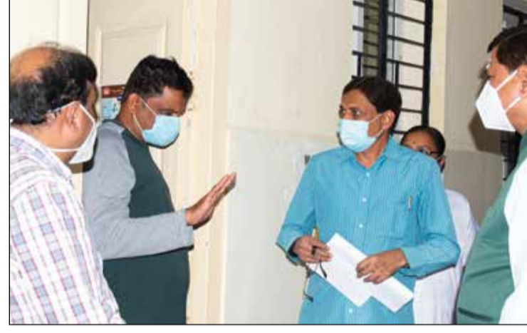
ಜಿಲ್ಲೆಯಲ್ಲಿ ಕೋವಿಡ್ ಪ್ರಕರಣಗಳು ಹೆಚ್ಚುತ್ತಿರುವ ಹಿನ್ನೆಲೆಯಲ್ಲಿ ಜಿಲ್ಲಾಧಿಕಾರಿ ಮಹಾಂತೇಶ ಬೀಳಗಿ ಅವರು ಜಿಲ್ಲಾ ಚಿಗಟೀರಿ ಸಾರ್ವಜನಿಕ ಸರ್ಕಾರ ಆಸ್ಪತ್ರೆಗೆ ಶನಿವಾರ ಸಂಜೆ ಭೇಟಿ ನೀಡಿ ಸಿಡ್ಡೆಗಳನ್ನು ಪರಿಶೀಲಿಸಿದರು. ಜಿಲ್ಲಾ ಸರ್ವೆಕ್ಷನ್‌ಧಿಕಾರಿ ರಾಘವನ್ ಸೇರಿದಂತೆ ಆರೋಗ್ಯ ಇಲಾಖೆಯ ಅಧಿಕಾರಿಗಳು ಈ ಸಂದರ್ಭದಲ್ಲಿದ್ದರು.

ದಾವಣಗೆರೆ, ಜ. 8- ಆಧುನಿಕ ಹೈನುಗಾರಿಕೆ ಕುರಿತು ತರಬೇತಿಯು ಇದೇ ದಿನಾಂಕ 20 ಮತ್ತು 21 ರಂದು ಪಶು ಆಸ್ಪತ್ರೆ ಆವರಣದಲ್ಲಿರುವ ಪಶುಪಾಲನಾ ಮತ್ತು ಪಶುವೈದ್ಯಕೀಯ ತರಬೇತಿ ಕೇಂದ್ರದಲ್ಲಿ ನಡೆಯಲಿದೆ. ವಿವರಕ್ಕೆ ಸಂಪರ್ಕಿಸಿ : 08192 - 233787.