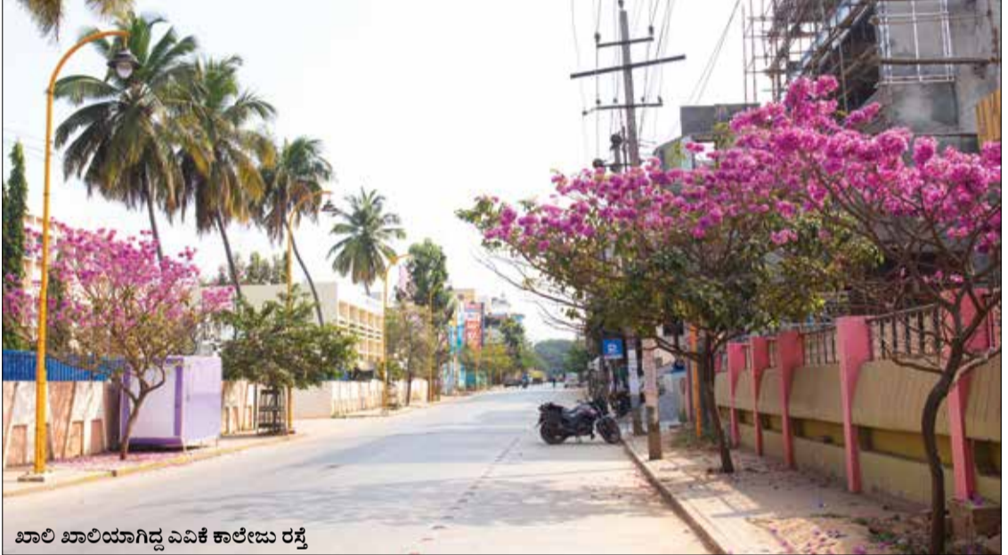
ಖಾಲಿ ಖಾಲಿಯಾಗಿದ್ದ ಎಮಿಕೆ ಕಾಲೇಜು ರಸ್ತೆ