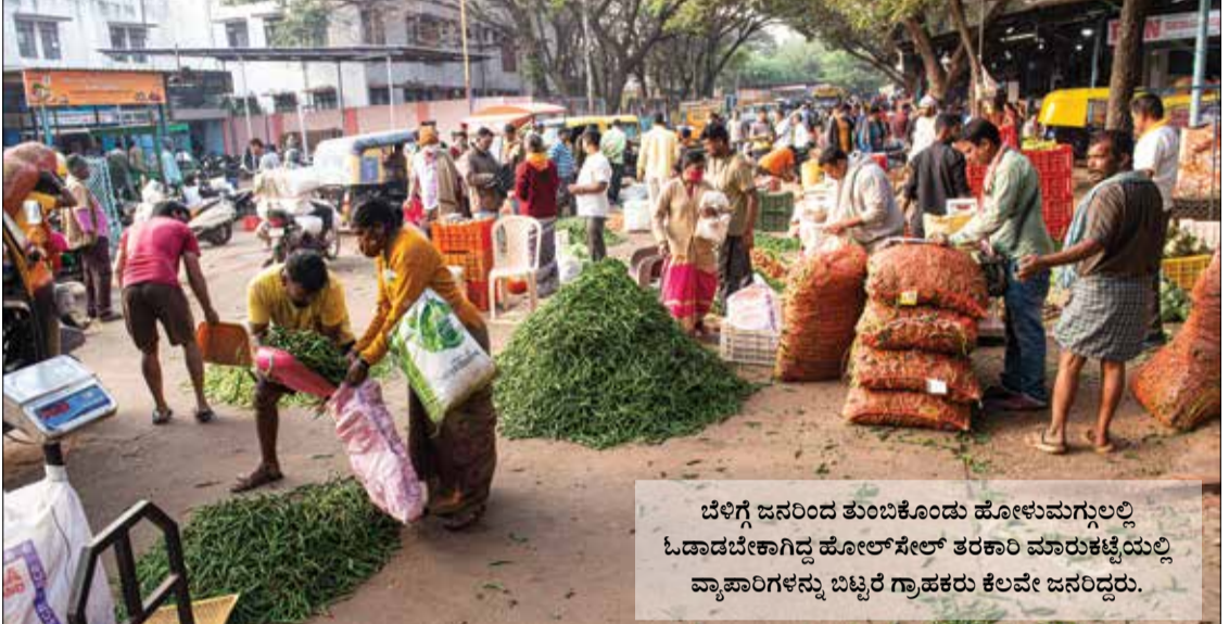
ಬೆಳಿಗ್ಗೆ ಜನರಿಂದ ತುಂಬಿಕೊಂಡು ಹೋಳುಮುಗ್ಗುಲಲ್ಲಿ ಓಡಾಡಬೇಕಾಗಿದ್ದ ಹೋಲ್‌ಸೇಲ್ ತರಕಾರಿ ಮಾರುಕಟ್ಟೆಯಲ್ಲಿ ವ್ಯಾಪಾರಿಗಳನ್ನು ಬಿಟ್ಟರೆ ಗ್ರಾಹಕರು ಕೆಲವೇ ಜನರಿದ್ದರು.

ಮಾಸ್ಕ್ ಧರಿಸಲು ನಿರ್ಲಕ್ಷ್ಯ ವಾರಾಂತ್ಯದ ಕರ್ಫ್ಯೂಗೆ ಉತ್ತಮ ಸ್ಪಂದನೆ ನೀಡಿದ ಜನತೆ ಮಾಸ್ಕ್ ಧರಿಸುವಲ್ಲಿ ಮಾತ್ರ ತೋರುತ್ತಿದ್ದುದು ಕಂಡು ಬಂತು. ನಗರದಲ್ಲಿ ಸಂಚರಿಸುತ್ತಿದ್ದ ವಾಹನ ಸವಾರರು, ಬಸ್ ಪ್ರಯಾಣಿಕರು, ಆಟೋಗಳ ಚಾಲಕರು ಹಾಗೂ ಪ್ರಯಾಣಿಕರಲ್ಲಿ ಬೆರಳೆಣಿಕೆಯಷ್ಟು ಜನರು ಮಾಸ್ಕ್ ಧರಿಸುತ್ತಿದ್ದುದು ಬಿಟ್ಟರೆ ಉಳಿದವರ ಮಾಸ್ಕ್‌ಗಳು ಜೇಬಿನಲ್ಲಿ ಅಥವಾ ವ್ಯಾನಿಟಿ ಬ್ಯಾಗ್‌ನಲ್ಲಿ ಬೆಚ್ಚಿರುತ್ತಿದ್ದವು. ಇತ್ತ ಬೆಳಿಗ್ಗೆ ತರಕಾರಿ ಮಾರುಕಟ್ಟೆಯೂ ಸೇರಿದಂತೆ ರೀಟೇಲ್ ವ್ಯಾಪಾರಿಗಳು, ಹಣ್ಣು ವ್ಯಾಪಾರಿಗಳು ಹಾಗೂ ಗ್ರಾಹಕರು ಮಾಸ್ಕ್ ಧರಿಸುತ್ತಿರಲಿಲ್ಲ. ಕೆಲವರ ಮಾಸ್ಕ್ ಕುತ್ತಿಗೆ ಮೇಲಿರುತ್ತಿದ್ದವು.