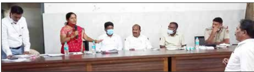
ಎಸ್ಸಿ-ಎಸ್ಸಿ ಹಿತರಕ್ಷಣಾ ಜಾಗೃತ ಸಭೆಯಲ್ಲಿ ಶಾಸಕ ರಾಮಪ್ಪ ಸೂಚನೆ