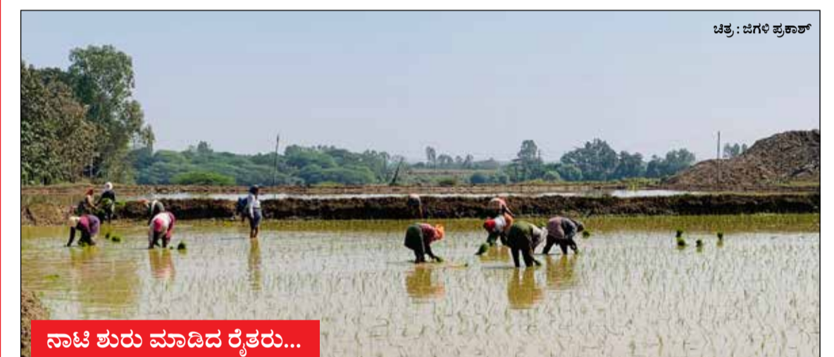
ನಾಟಿ ಶುರು ಮಾಡಿದ ರೈತರು... ಬೇಸಿಗೆ ಹಂಗಾಮಿನ ಬೆಳೆಗಳಿಗಾಗಿ ಭದ್ರಾ ಜಲಾಶಯದಿಂದ ನಾಲೆಗಳಿಗೆ ಬಿಟ್ಟಿರುವ ನೀರಿನಲ್ಲಿ ಅಚ್ಚುಕಟ್ಟಿನ ರೈತರು ಭತ್ತದ ಸಸಿ ಮಡಿ ಸಿದ್ಧಪಡಿಸುತ್ತಿದ್ದರೆ ಇತ್ತ ದೇವರಬೆಳಕೆ ಏಕಪ್ ಜಲಾಶಯ ಮತ್ತು ತುಂಗಭದ್ರಾ ನದಿ ಪಾತ್ರದ ರೈತರು ಈಗಾಗಲೇ ಬೆಳೆಸಿರುವ ಭತ್ತದ ಸಸಿಯಿಂದ ನಾಟಿ ಮಾಡುತ್ತಿರುವ ದೃಶ್ಯ ಗುರುವಾರ ಉಕ್ಕಡಗಾತ್ರ ಸಮೀಪ ಕಂಡು ಬಂತು.