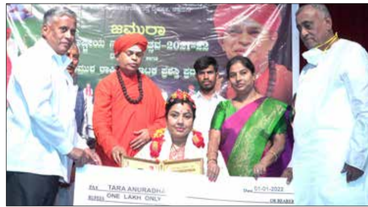
ನಟ ತಾರಾ ಅವರಿಗೆ 2021ನೇ ಸಾಲಿನ ಶಿವಮೊದಲ ರಾಷ್ಟ್ರೀಯ ನಾಟಕ ಪ್ರಶಸ್ತಿ ಪ್ರದಾನ ಮಾಡಲಾಯಿತು.

ಚಿತ್ರದುರ್ಗ, ಜಿ. 1- ಅಭಿನಯ, ಅಭಿವ್ಯಕ್ತಿ, ಹಾಡುಗಾರಿಕೆ ಪ್ರದರ್ಶಿಸಲು ಸೂಕ್ತವಾದ ವೇದಿಕೆ ನಾಟಕ ರಂಗ. ಇಲ್ಲಿ ಸಚಿವ ಅರ್ಧಾತ್ ನೈಜತೆ ಇರುತ್ತದೆ ಎಂದು ಸಚಿವ ಸಚಿವ ವಿ. ಸೋಮಣ್ಣ ಹೇಳಿದರು.