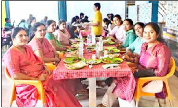
ಹೊಸ ವರ್ಷದ ಅಂಗವಾಗಿ ಹೋಟೆಲ್‌ನಲ್ಲಿ ಮೆಟ್ರೋಪಾಲಿಟನ್ ಭೋಜನ ಕೂಟ