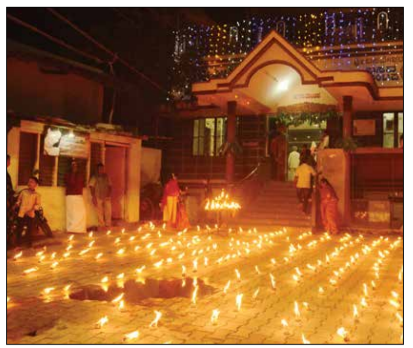
ವಿಜೃಂಭಣೆಯ ದಾನಮ್ಮ ದೇವಿ ಕಾರ್ತಿಕ