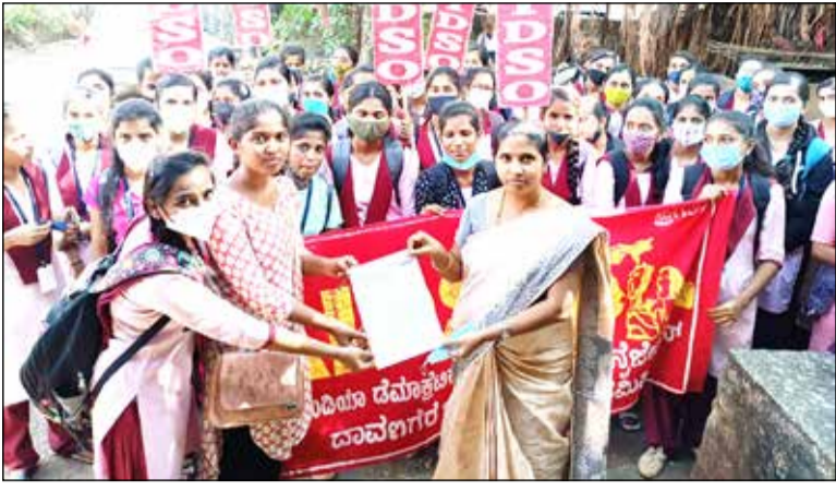
ನಗರದಲ್ಲಿ ಎಐಡಿಎಸ್‌ಒ ನೇತೃತ್ವದಲ್ಲಿ ಪ್ರತಿಭಟನೆ

ದಾವಣಗೆರೆ, ಡಿ.20- ರಾಜ್ಯದ ವಿವಿಧ ಸರ್ಕಾರಿ ಕಾಲೇಜುಗಳಲ್ಲಿ ಕಾರ್ಯ ನಿರ್ವಹಿಸುತ್ತಿರುವ ಅತಿಥಿ ಉಪನ್ಯಾಸಕರ ಬೇಡಿಕೆಗಳನ್ನು ಈಡೇರಿಸಬೇಕೆಂದು ಒತ್ತಾಯಿಸಿ ಆಲ್ ಇಂಡಿಯಾ ಡೆಮಾಕ್ರಟಿಕ್ ಸ್ಟೂಡೆಂಟ್ಸ್ ಆರ್ಗನೈಸೇಷನ್ (ಎಐಡಿಎಸ್‌ಒ) ನೇತೃತ್ವದಲ್ಲಿ ನಗರದಲ್ಲಿ ಇಂದು ವಿವಿಧ ಕಾಲೇಜುಗಳ ವಿದ್ಯಾರ್ಥಿಗಳು ಪ್ರತಿಭಟನೆ ನಡೆಸಿದರು.