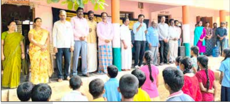
ಜಿಗಳಿಯಲ್ಲಿ ಸಂವಿಧಾನ ದಿನಾಚರಣೆ

ಸಂವಿಧಾನದ ಚೌಕಟ್ಟುಗಳ ಕೊಡುಗೆಯನ್ನು ಅಂಗೀಕರಿಸಲು ಮತ್ತು ಪ್ರಮುಖ ಮೌಲ್ಯಗಳಿಗೆ ಸಂಬಂಧಿಸಿದಂತೆ ಜನರನ್ನು ಉಲ್ಲೇಖಿಸಲು ನವೆಂಬರ್ 26 ಅನ್ನು ಸಂವಿಧಾನ ದಿನವನ್ನಾಗಿ ಆಚರಿಸಲಾಗುತ್ತಿದೆ ಎಂದು ತಿಳಿಸಿದರು.