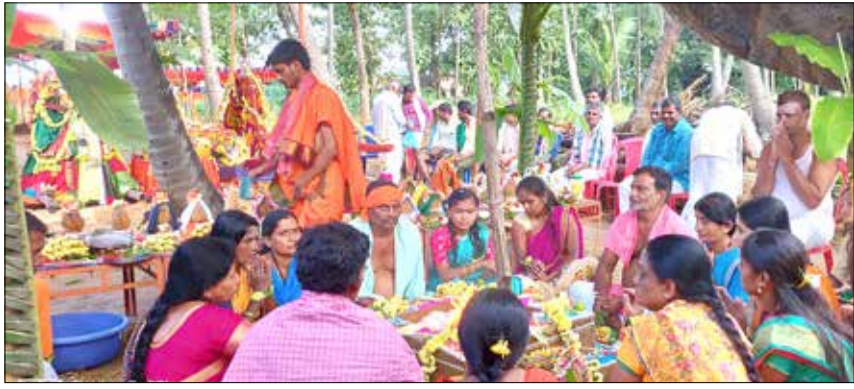
ಕನಗೊಂದನಹಳ್ಳಿಯಲ್ಲಿ ರುದ್ರ ಹೋಮ

ಕನಗೊಂದನಹಳ್ಳಿ ಗ್ರಾಮದಲ್ಲಿ ಶ್ರೀ ಮಹೇಶ್ವರ ಸ್ವಾಮಿ, ಶ್ರೀ ನಂದೀಶ್ವರ ಸ್ವಾಮಿ ಶಿಲಾಮೂರ್ತಿ ಪ್ರಾಣ ಪ್ರತಿಷ್ಠಾಪನೆ ಹಿನ್ನೆಲೆಯಲ್ಲಿ ನಡೆದ ರುದ್ರ ಹೋಮದಲ್ಲಿ ಗ್ರಾಮಸ್ಥರು ಭಾಗಿಯಾಗಿದ್ದರು.