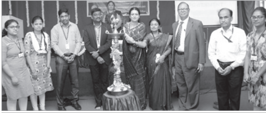
ಮಹಿಳಾ ಸಬಲೀಕರಣದ ನೈಪುಣ್ಯತಾ ಕೇಂದ್ರದ ಉದ್ಘಾಟನೆ