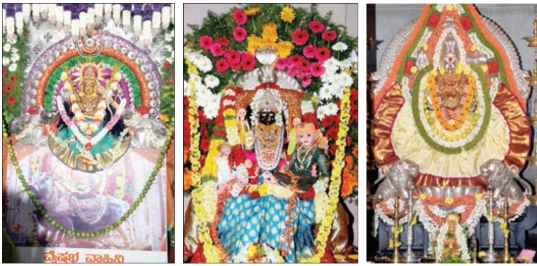
ನಗರ ದೇವತೆ ಶ್ರೀ ದುರ್ಗಾಂಬಿಕಾ ದೇವಿ ದಾವಲ್ ಪೇಟೆಯ ಶ್ರೀ ಚೌಡೇಶ್ವರಿ ದೇವಿ ನಿಟ್ಟವಳ್ಳಿ ಶ್ರೀ ದುರ್ಗಾಂಬಿಕಾ ದೇವಿ