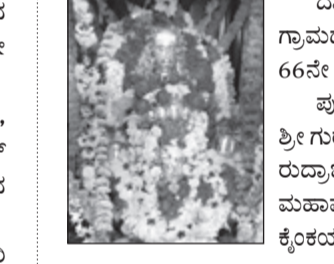
ದಾವಣಗೆರೆ, ಅ.7 - ತಾಲ್ಲೂಕಿನ ಶ್ಯಾಗಲೆ ಗ್ರಾಮದ ಶ್ರೀ ಗುರು ಕರಿಸಿದ್ದೇಶ್ವರ ಸ್ವಾಮಿಗಳ 66ನೇ ಪುಣ್ಯಾರಾಧನೆ ಇಂದು ನಡೆಯಿತು.