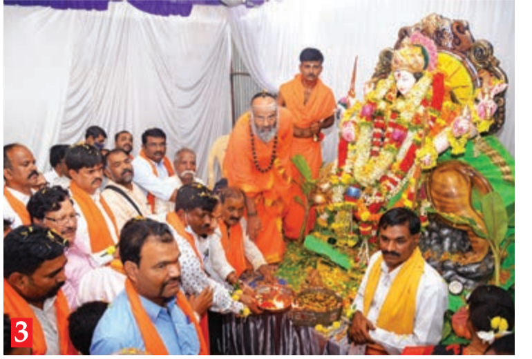
1. ಮೈಸೂರು ದಸರಾಕ್ಕೆ ಮಾಜಿ ಮುಖ್ಯಮಂತ್ರಿ ಎಸ್. ಎಂ. ಕೃಷ್ಣ ಅವರು ಬೆಳ್ಳಿ ರಥದಲ್ಲಿರುವ ಚಾಮುಂಡೇಶ್ವರಿ ಮೂರ್ತಿಗೆ ಪುಷ್ಪಾರ್ಚನೆ ಮಾಡುವ ಮೂಲಕ ವಿಧ್ಯುಕ್ತವಾಗಿ ಚಾಲನೆ ನೀಡಿದರು. 2. ದಾವಣಗೆರೆ ನಗರ ದೇವತೆ ಶ್ರೀ ದುರ್ಗಾಂಬಿಕಾ ದೇವಸ್ಥಾನದಲ್ಲಿ ಶಾಸಕ ಶಾಮನೂರು ಶಿವಶಂಕರಪ್ಪ, ಎಸ್.ಎಸ್. ಮಲ್ಲಿಕಾರ್ಜುನ್ ಹಾಗೂ ಕುಟುಂಬದವರು ಶ್ರೀ ದೇವಿಗೆ ಪೂಜೆ ಸಲ್ಲಿಸಿ ದಸರಾಗೆ ಚಾಲನೆ ನೀಡಿದರು. 3. ಪಿ.ಬಿ. ರಸ್ತೆಯ ಶ್ರೀ ಬೀರಲಿಂಗೇಶ್ವರ ದೇವಸ್ಥಾನದ ಆವರಣದಲ್ಲಿ ಆವರಣಕ್ಕೂ ಶ್ರೀಗಳು ದುರ್ಗಾದೇವಿ ಘಟ ಸ್ಥಾಪನೆ ಮಾಡುವ ಮೂಲಕ ನವರಾತ್ರಿ ಉತ್ಸವಕ್ಕೆ ಚಾಲನೆ ನೀಡಿದರು.