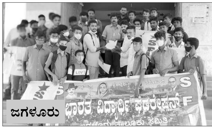
ಜಗಳೂರು ಭಾರತ ವಿದ್ಯಾರ್ಥಿ ಫೆಡರೇಷನ್ ಸಮಿತಿ

ಜಗಳೂರು, ಆ.30- ತಾಲ್ಲೂಕಿನಲ್ಲಿ ಐಟಿಐ ಎಸ್‌ಸಿವಿಟಿ, ಎಸ್‌ಸಿವಿಟಿ ಪರೀಕ್ಷಾ ಕೇಂದ್ರ ತೆರೆಯಲು ಒತ್ತಾಯಿಸಿ, ಭಾರತ ವಿದ್ಯಾರ್ಥಿ ಫೆಡರೇಷನ್ ನೇತೃತ್ವದಲ್ಲಿ ಇಂದು ವಿದ್ಯಾರ್ಥಿಗಳು ಪ್ರತಿಭಟನೆ ನಡೆಸಿದರು.