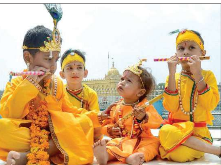
ಶ್ರೀ ಕೃಷ್ಣ ಜನ್ಮಾಷ್ಟಮಿ ಅಂಗವಾಗಿ ಬುಧವಾರ ದಾವಣಗೆರೆ ನಗರ ದೇವತೆ ಶ್ರೀ ದುರ್ಗಾಂಬಿಕಾ ದೇವಸ್ಥಾನದ ಬಳಿ ಇರುವ ಶ್ರೀ ಕೃಷ್ಣನ ದೇವಸ್ಥಾನದಲ್ಲಿ ಶ್ರೀ ಕೃಷ್ಣನ ವಿಗ್ರಹವನ್ನು ಬೆಳ್ಳಿಯಿಂದ ಅಲಂಕರಿಸಲಾಗಿತ್ತು. ಪಂಚಾಂಗ ಅಮೃತಸರದಲ್ಲಿ ಶ್ರೀ ಕೃಷ್ಣನ ವೇಷ ತೊಟ್ಟು ಪುಜಾರಿಗಳ ತಂಡ. (ಬಲಚಿತ್ರ)