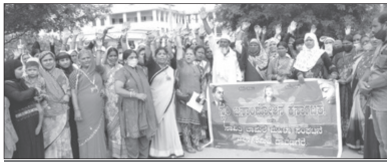
ಸ್ಥಳೀಯ ಜನಾಂಗದ ಕರ್ನಾಟಕ ನೇತೃತ್ವದಲ್ಲಿ ಖಂಡನೆ