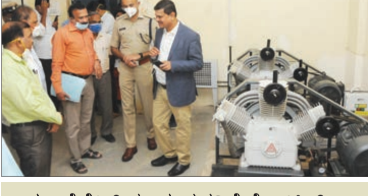
ಅರ್ಧ ಹೆಲಿಕ್ಟ್ ಮಾರುವವರಿಗೆ ನೋಟಿಸ್

ದಾವಣಗೆರೆ, ಆ. 2 - ಬರುವ ಆಗಸ್ಟ್ 15ರ ಒಳಗೆ ಜಿಲ್ಲಾದ್ಯಂತ ಸರ್ಕಾರಿ ಆಸ್ಪತ್ರೆಗಳಲ್ಲಿ ಇರುವ ಆಕ್ಸಿಜನ್ ಉತ್ಪಾದನಾ ಘಟಕಗಳನ್ನು ಚಾಲನೆಗೊಳಿಸಲಾಗುವುದು ಎಂದು ಜಿಲ್ಲಾಧಿಕಾರಿ ಮಹಾಂತೇಶ್ ಬೀಳಗಿ ತಿಳಿಸಿದ್ದಾರೆ. ಜಿಲ್ಲಾ ಚಿಗಟೇರಿ ಆಸ್ಪತ್ರೆಗೆ ಭೇಟಿ ನೀಡಿ ವಿವಿಧ ಕಾಮಗಾರಿಗಳ ಪರಿಶೀಲನೆ ನಂತರ ಪತ್ರಕರ್ತರೊಂದಿಗೆ ಮಾತನಾಡುತ್ತಿದ್ದ ಅವರು, ಚಿಗಟೇರಿ ಆಸ್ಪತ್ರೆಯಲ್ಲಿ ಪ್ರತಿ ನಿಮಿಷಕ್ಕೆ 3,000 ಲೀಟರ್ ಆಕ್ಸಿಜನ್ ಉತ್ಪಾದಿಸುವ ಒಟ್ಟು ಮೂರು ಘಟಕಗಳನ್ನು ಸ್ಥಾಪಿಸಲಾಗುತ್ತಿದೆ. ಇದರ ಜೊತೆಗೆ ಮಕ್ಕಳ ಐ.ಸಿ.ಯು. ಘಟಕವನ್ನೂ ಸಿದ್ಧ ಪಡಿಸಲಾಗುತ್ತಿದೆ. ಇವೆರಡೂ ಆಗಸ್ಟ್ 15ರ ಒಳಗೆ ಸಿದ್ಧವಾಗಿವೆ ಎಂದರು.