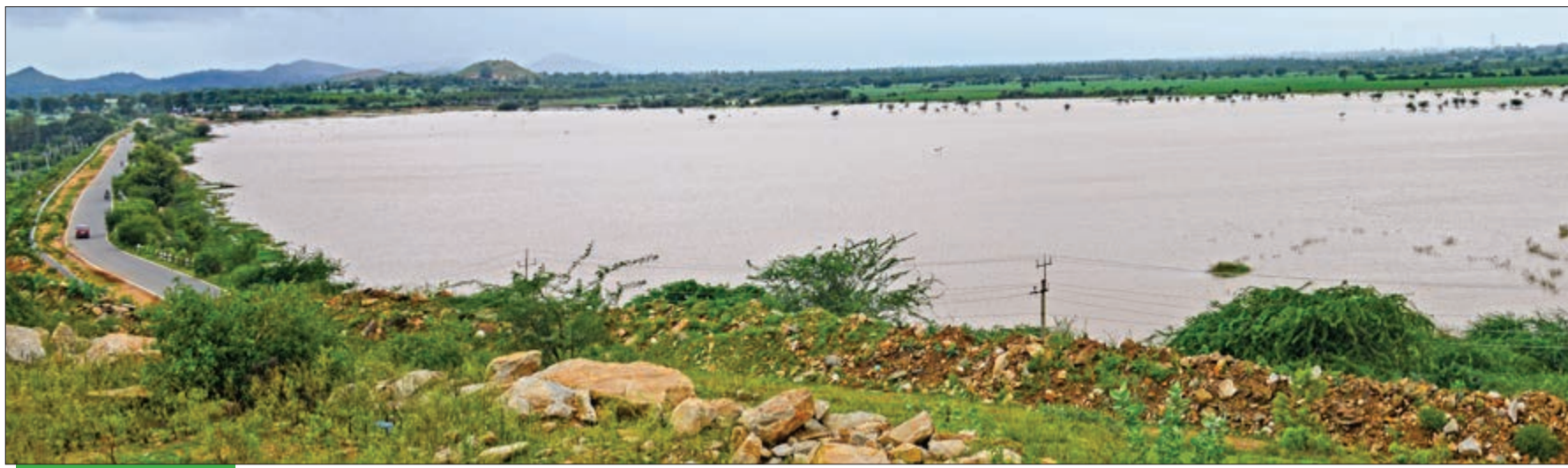
ಅಣಜಿ ಕೆರೆ ಸುಂದರ

ಸಂಪುಟ : 48 ಸಂಚಿಕೆ : 68 ಫೋನ್ : 254736 91642 99999 RNI No: 27369/75 KA/SK/CTA-275/2021-2023. O/P @ J.D. Circle P.O. ಪುಟ : 4 ರೂ : 4.00 www.janathavani.com janathavani@mac.com