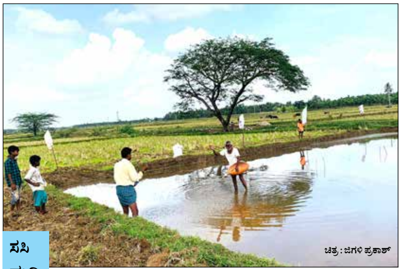
ಭದ್ರಾ ಅಚ್ಚುಕಟ್ಟಿನಲ್ಲಿ ಭತ್ತದ ಕೆಲಸವು ಬಹುತೇಕ ಮುಗಿದಿದ್ದು, ರೈತರು ಈಗ ಮುಂಗಾರು ಹಂಗಾಮಿನ ನಾಟಗಾಗಿ ಭತ್ತದ ಸಸಿ ಮಡಿ ಬೆಳೆಸಲು ಮುಟ್ಟುಕಟ್ಟಿ ಸಮೀಪ ಮಂಗಳವಾರ ಬೀಜ ಚೆಲ್ಲಿದರು.