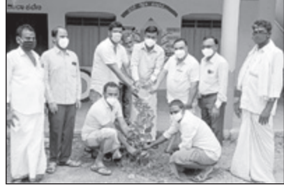
ದಾವಣಗೆರೆ, ಜೂ. 5 - ಎಲೆಬೇತೂರು ಗ್ರಾಮದ ಗ್ರಾಮ ಪಂಚಾಯತಿ ವತಿಯಿಂದ ವಿಶ್ವ ಪರಿಸರ ದಿನಾಚರಣೆಯ ಅಂಗವಾಗಿ

ಗ್ರಾಮ ಪಂಚಾಯತಿ ಆವರಣ ಮತ್ತು ಸರ್ಕಾರಿ ಹಿರಿಯ ಪ್ರಾಥಮಿಕ ಶಾಲೆ ಆವರಣದಲ್ಲಿ ಸಸಿ ನೆಡುವುದರ ಮೂಲಕ ಆಚರಿಸಲಾಯಿತು.