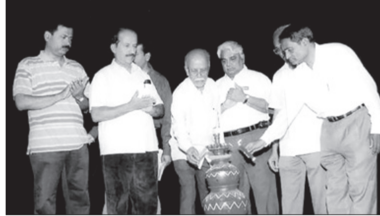
ಬಿಜಿಎನ್ ಸ್ಥಾಪಿಸಿದ 'ಪ್ರತಿಮಾ ಸಭಾ' ಉದ್ಘಾಟನಾ ಸಮಾರಂಭದ ಸ್ಮರಣೀಯ ಚಿತ್ರ.

(1ನೇ ಪುಟದಿಂದ) ಉಣಬಡಿಮುತ್ತಿದ್ದರು. ಈ ಹಿನ್ನೆಲೆಯಲ್ಲಿ ಯಾವುದೇ ಸಭೆ - ಸಮಾರಂಭಗಳಲ್ಲಿ ಅವರು ಭಾಗವಹಿಸುತ್ತಿದ್ದಾರೆ ಎಂಬ ವಿಚಾರ ತಿಳಿದೊಡನೆ ಆ ಸಭಾಂಗಣ ಕಿಕ್ಕಿರಿದು ತುಂಬಿರುತ್ತಿತ್ತು. ಇದರಿಂದಾಗಿ 20 ವರ್ಷಗಳ ಹಿಂದೆ ಸುಮಾರು 3 ದಶಕಗಳ ಕಾಲ ಸ್ಥಳೀಯ ಮಾತೃ ವಲ್ಲದೇ ಮಧ್ಯ ಕರ್ನಾಟಕದ ಬಹುತೇಕ ಶಾಲಾ - ಕಾಲೇಜುಗಳು, ಸಾಂಸ್ಕೃತಿಕ ಸಂಘ - ಸಂಸ್ಥೆಗಳು ತಮ್ಮ ಕಾರ್ಯಕ್ರಮಗಳಿಗೆ ಬಿಜಿಎನ್ ಅವರನ್ನು ಆಹ್ವಾನಿಸಲು ಮುಗಿ ಬಿಳುತ್ತಿದ್ದವು. ಕೆಲವು ಸಂದರ್ಭಗಳಲ್ಲಿ ಅವರನ್ನು ಅನುಮತಿ ಪಡೆಯದೇ ಆಹ್ವಾನ ಪತ್ರಗಳಲ್ಲಿ ಬಿಜಿಎನ್ ಹೆಸರು ಮುದ್ರಿತವಾಗಿದ್ದು ಪ್ರಸಂಗಗಳು ನಡೆವಿವೆ.