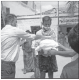
ಅಜೀಮ್ ಪ್ರೇಮ್ ಜೀ ಫೌಂಡೇಷನ್ (ಬಳ್ಳಾರಿ) ಸೇವೆ