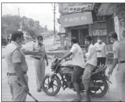
ಏಟಿನ ಬಿಸಿ ತೋರಿಸಿದ್ದಾರೆ. ಲಾಕ್‌ಡೌನ್ ಹಿನ್ನೆಲೆಯಲ್ಲಿ ಮೆಡಿಕಲ್ ಶಾಪ್‌ಗಳು, ಬ್ಯಾಂಕ್‌ಗಳು, ಸಾರ್ವಜನಿಕ ಕಚೇರಿಗಳು ಎಂದಿನಂತೆ ತೆರೆದಿದ್ದವು.

ಜಗಳೂರು, ಮೇ 10- ರಾಜ್ಯದಲ್ಲಿ ಕಟ್ಟು ನಿಟ್ಟಿನ 2 ವಾರಗಳ ಕಾಲ ಸರ್ಕಾರ ಲಾಕ್‌ಡೌನ್ ವಿಧಿಸಿದ ಹಿನ್ನೆಲೆಯಲ್ಲಿ ಜಗಳೂರು ಪಟ್ಟಣದಲ್ಲಿ 10 ಗಂಟೆಯ ಮೇಲೆ ಅನವಶ್ಯಕವಾಗಿ ಹೊರಗೆ ಬೈಕ್ ಸೇರಿದಂತೆ ಇತರ ವಾಹನಗಳಲ್ಲಿ ಬರುತ್ತಿರುವ ಜನರಿಗೆ ಸಿಪಿಐ ಮಂಜುನಾಥ್ ಪಂಡಿತ್ ನೇತೃತ್ವದಲ್ಲಿ ಪಿಎಸ್‌ಐ, ಪೊಲೀಸ್ ಸಿಬ್ಬಂದಿ ಎಚ್ಚರಿಕೆ ನೀಡಿದರಲ್ಲದೇ ಅನವಶ್ಯಕವಾಗಿ ತಿರುಗಾಡಿದ ಬೈಕ್ ಸವಾರರಿಗೆ ಬೆತ್ತದ ರುಚಿ ತೋರಿಸಿದರು.