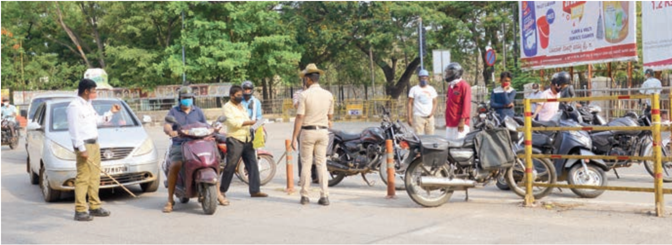
ಲಾಕ್‌ಡೌನ್ ಇದ್ದರೂ ದಾವಣಗೆರೆ ರಸ್ತೆಯಲ್ಲಿ ಓಡಾಡುತ್ತಿದ್ದ ವಾಹನಗಳನ್ನು ಪೊಲೀಸರು ಪರಿಶೀಲಿಸುತ್ತಿರುವುದು.