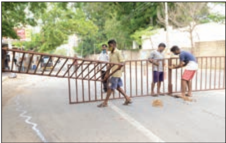
ವಾಹನ ನಿರ್ಬಂಧಿಸಲು ಕಬ್ಬಿಣದ ಗೇಟ್ ಆಳವಡಿಸುತ್ತಿರುವುದು.