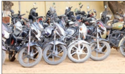
ಪೊಲೀಸ್ ವಶದಲ್ಲಿರುವ ಬೈಕ್‌ಗಳು