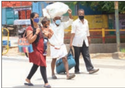
ಪರ ಊರಿನಿಂದ ಬಂದವರು ಕಾಲ್ನಡಿಗೆಯಲ್ಲಿ ತೆರಳುತ್ತಿರುವುದು