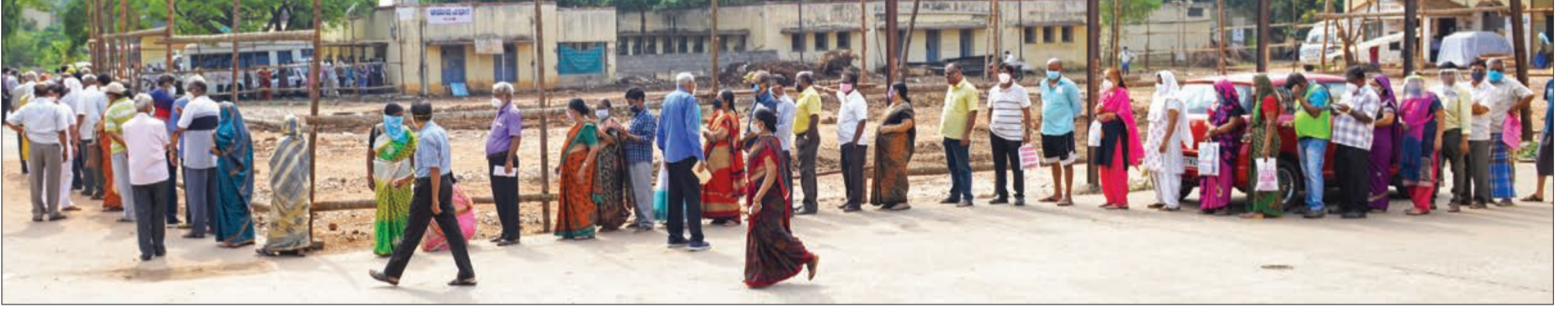
ದಾವಣಗೆರೆ : ಅರೆ ಬರೆ ಧರಿಸಿದ ಮಾಸ್ಕು, ಒಬ್ಬರ ಮೇಲೊಬ್ಬರು ಬೀಳುವಂತೆ ನಿಲ್ಲುವುದು, ಅಂತರವಿಲ್ಲದೇ ನಿರ್ಲಕ್ಷ್ಯ, ಉದ್ದನೆಯ ಸರದಿ... ಇವು ನಗರದ ಕೊರೋನಾ ಲಸಿಕಾ ಕೇಂದ್ರಗಳ ಬಳಿ ಕಂಡು ಬಂದ ದೃಶ್ಯಗಳು.

ಸಂಪುಟ : 47 ಸಂಚಿಕೆ : 353 ಫೋನ್ : 254736 91642 99999 RNI No: 27369/75, KA/SK/CTA-275/2021-2023. O/P @ J.D. Circle P.O. ಪುಟ : 4 ರೂ : 4.00 www.janathavani.com janathavani@mac.com