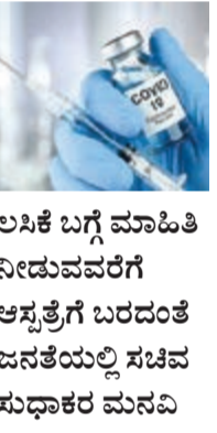
ಲಸಿಕೆ ಬಗ್ಗೆ ಮಾಹಿತಿ ನೀಡುವವರೆಗೆ ಆಸ್ಪತ್ರೆಗೆ ಬರದಂತೆ ಜನತೆಯಲ್ಲಿ ಸಚಿವ ಸುಧಾಕರ ಮನವಿ

18 ರಿಂದ 44 ವಯಸ್ಸಿನವರಿಗೆ ಕೇಂದ್ರ ಸರ್ಕಾರ ಉಚಿತ ಲಸಿಕೆಗಳನ್ನು ಪೂರೈಸುತ್ತಿಲ್ಲ. ಈ ವರ್ಗಕ್ಕೆ ರಾಜ್ಯ ಸರ್ಕಾರವೇ ಉಚಿತ ಲಸಿಕೆ ನೀಡಲಿದೆ ಎಂದು ಮುಖ್ಯಮಂತ್ರಿ ಬಿ.ಎಸ್. ಯಡಿಯೂರಪ್ಪ ಪ್ರಕಟಿಸಿದ್ದರು. ಸರ್ಕಾರಿ ಆಸ್ಪತ್ರೆಗಳಲ್ಲಿ ಲಸಿಕೆ ಪಡೆದವರಿಗೆ ಮಾತ್ರ ಉಚಿತ ಲಸಿಕೆ ಎಂದು ಹೇಳಿದ್ದರು. ಆದರೆ ಉಚಿತ ಲಸಿಕೆ ವಿಳಂಬವಾಗಲಿದೆ. ಇನ್ನು ಲಸಿಕಾ ಕಂಪನಿಗಳು ಲಸಿಕೆಯನ್ನು ನಾಳೆಯಿಂದ ದುಬಾರಿ ದರದಲ್ಲಿ ಮುಕ್ತ ಮಾರುಕಟ್ಟೆಗೆ ಬಿಡುಗಡೆ ಮಾಡುತ್ತಿವೆ. ಖಾಸಗಿ ಆಸ್ಪತ್ರೆಗಳಲ್ಲಿ ನಿಗದಿತ ದರ ಪಾವತಿಸಿ, ಲಸಿಕೆ ಪಡೆದುಕೊಳ್ಳಬಹುದು. 45 ವರ್ಷ ಮೇಲ್ಪಟ್ಟವರಿಗೆ ಕೇಂದ್ರ ಈಗಿನ (2ನೇ ಪುಟಕ್ಕೆ)