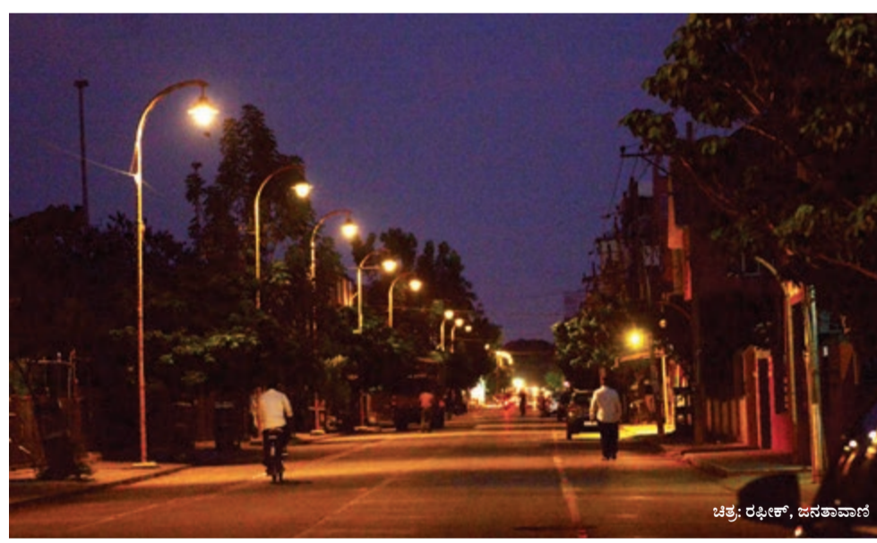
ಲೈಟ್ ನೈಟ್ ಕೊರೋನಾ ಕಷ್ಟಕ್ಕೆ ಹಿನ್ನೆಲೆಯಲ್ಲಿ ದಾವಣಗೆರೆ ಮುಖ್ಯ ರಸ್ತೆಗಳು ರಾತ್ರಿ ಖಾಲಿಯಾಗಿದ್ದವು. ಬೀದಿ ದೀಪಗಳ ಬೆಳಕಿನೊಂದಿಗೆ ಕಂಗೊಳಿಸುತ್ತಿರುವ ಎಂ.ವಿ.ಕೆ ರಸ್ತೆಯ ಚಿತ್ರವಿದು.

ನವದೆಹಲಿ, ಏ. 30 - ಕೇಂದ್ರ ಸಚಿವರು ಜನರ ಸಂಪರ್ಕದಲ್ಲಿರಬೇಕು ಹಾಗೂ ಅವರಿಂದ ಪರಿಸ್ಥಿತಿಯ ಕುರಿತು ವಿವರ ಪಡೆಯುತ್ತಿರಬೇಕು ಎಂದು ಪ್ರಧಾನ ಮಂತ್ರಿ ನರೇಂದ್ರ ಮೋದಿ ತಿಳಿಸಿದ್ದಾರೆ. ಮಂತ್ರಿಮಂಡಲದ ಸಭೆಯ ಅಧ್ಯಕ್ಷತೆ ವಹಿಸಿ ಮಾತನಾಡುತ್ತಿದ್ದ ಪ್ರಧಾನಿ, ಸ್ಥಳೀಯ ವಿಷಯಗಳನ್ನು ಗುರುತಿಸಿ ಅವುಗಳನ್ನು ಬಗೆಹರಿಸಬೇಕು ಎಂದು ತಿಳಿಸಿದ್ದಾರೆ ಎಂದು ಅಧಿಕೃತ ಹೇಳಿಕೆಯಲ್ಲಿ (3ನೇ ಪುಟಕ್ಕೆ)