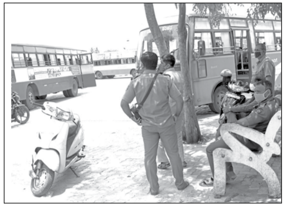
ರಸ್ತೆಗಳಲ್ಲಿ ಅಡ್ಡವಾಗಿ ಬ್ಯಾರಿಕೇಡ್ ಇಟ್ಟು ಒಮ್ಮುಖ ರಸ್ತೆಗಳನ್ನಾಗಿ ಮಾಡಿ, ಪೊಲೀಸರು ವಾಹನಗಳ ತಪಾಸಣೆ ನಡೆಸುತ್ತಿದ್ದರು.

ಕೆಎಸ್‌ಟಿಎಸ್‌ಸಿ ಬಸ್ ನಿಲ್ದಾಣದಲ್ಲಿ ಪ್ರಯಾಣಿಕರ ಸಂಖ್ಯೆ ವಿರಳವಾಗಿತ್ತು. ಚಾಲಕರು, ನಿರ್ವಾಹಕರು ಅಲ್ಲಲ್ಲಿ ಹರಟೆಯಲ್ಲಿ ತಲ್ಲೀನರಾಗಿದ್ದರು. ಹೊರ ಜಿಲ್ಲೆಯಿಂದ ಬಂದ ಪ್ರಯಾಣಿಕರು ಆಟೋಗಳಲ್ಲದೆ ಸ್ವಂತ ವಾಹನ ಅಥವಾ ಕಾಲ್ಪಡಿಯಿಂದಲೇ ಮನೆ ಸೇರಬೇಕಿತ್ತು.