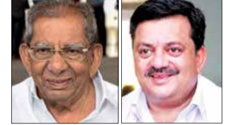
ಕೋವಿಡ್ ನಿಯಮಗಳನ್ನು ಪಾಲಿಸಲು ಜನತೆಗೆ ಮನವಿ