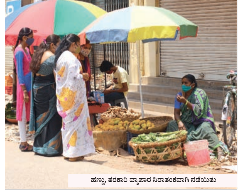
ಹಣ್ಣು ತರಕಾರಿ ವ್ಯಾಪಾರ ನಿರಾತಂಕವಾಗಿ ನಡೆಯಿತು