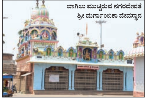
ಬಾಗಿಲು ಮುಚ್ಚಿರುವ ನಗರದವತೆ ಶ್ರೀ ಮರ್ಗಾಂಬಿಕಾ ದೇವಸ್ಥಾನ