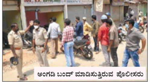
ಅಂಗಡಿ ಬಂದ್ ಮಾಡಿಸುತ್ತಿರುವ ಪೊಲೀಸರು

ದಾವಣಗೆರೆ, ಏ.21- ನಗರದಲ್ಲಿ ನೈಟ್ ಕರ್ಪೂರ್ ಮುಗಿಸಿ ಗುರುವಾರ ಮುಂಜಾನೆ ವ್ಯಾಪಾರ-ವಹಿವಾಟು ಶುಭಾರಂಭ ಮಾಡಿದ ವ್ಯಾಪಾರಿಗಳು ಮಧ್ಯಾಹ್ನವಾಗುತ್ತಲೇ ಪೊಲೀಸರು ಅಂಗಡಿಗಳನ್ನು ಬಂದ್ ಮಾಡಿ ಎನ್ನುತ್ತಿದ್ದ ಘೋಷಣೆಗೆ ದಂಗಾದರು.