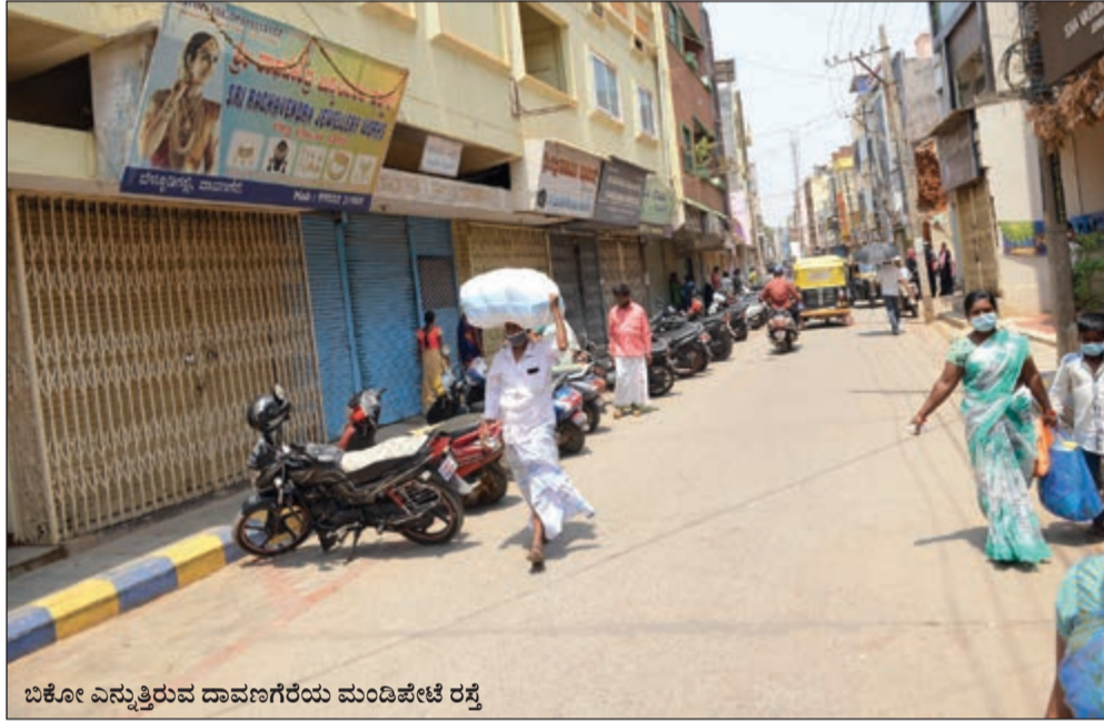
ಬಿಕೋ ಎನ್ನುತ್ತಿರುವ ದಾವಣಗೆರೆಯ ಮಂಡಿಪೇಟೆ ರಸ್ತೆ

ಬೆಳಿಗ್ಗೆ ಶುಭಾರಂಭ, ಮಧ್ಯಾಹ್ನ ವಹಿವಾಟು ಸ್ಥಗಿತ, ಸ್ವಪ್ನನೆ ಇಲ್ಲದೆ ಕಂಗಾಲಾದ ವ್ಯಾಪಾರಿಗಳು-ನಾಗರಿಕರು: ಜಿಲ್ಲಾಡಳಿತ, ಪೊಲೀಸರ ವಿರುದ್ಧ ಅಸಮಾಧಾನ