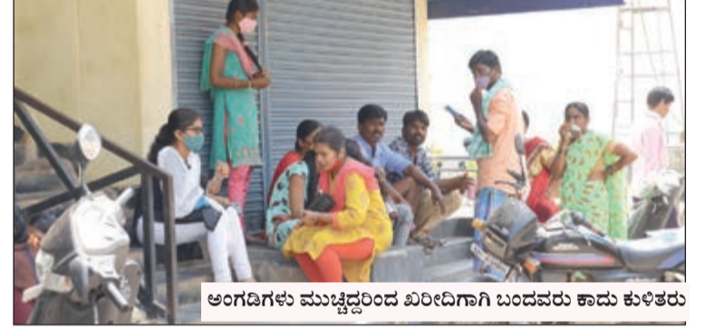
ಅಂಗಡಿಗಳು ಮುಚ್ಚಿದ್ದರಿಂದ ಖರೀದಿಗಾಗಿ ಬಂದವರು ಕಾದು ಕುಳಿತರು

ಬೆಳಿಗ್ಗೆ ತೆರೆದಿದ್ದ ಬಿ.ಎಸ್. ಚನ್ನಬಸಪ್ಪ ಡಿಪೇಟೆಯಲ್ಲಿ ಶೇ.75ರಷ್ಟು ಮಳಿಗೆಗಳು ಬಾಗಿಲು ಮುಚ್ಚಿದ್ದವು. ಜನಸಂಖ್ಯೆಯೂ ವಿರಳವಾಗಿತ್ತು.