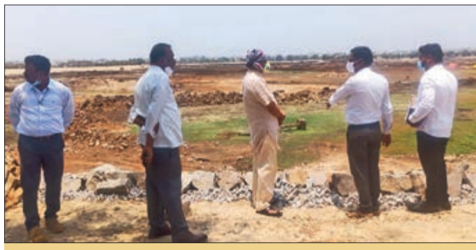
ಕುಂದುವಾಡ ಕೆರೆ ಪ್ರದೇಶಕ್ಕೆ ಜೀವವೈವಿಧ್ಯ ಮಂಡಳಿ ತಂಡದ ಭೇಟಿ