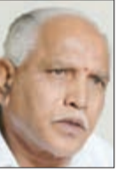
ತಮ್ಮ ವಿರುದ್ಧದ ಕ್ರಿಮಿನಲ್ (4ನೇ ಪುಟಕ್ಕೆ)

ನವದೆಹಲಿ, ಏ. 5 - ಜಮೀನು ಡಿನೋಟಿಫಿಕೇಷನ್ ನಲ್ಲಿ ಅವ್ಯವಹಾರ ನಡೆದಿದೆ ಎಂಬ ಆರೋಪಕ್ಕೆ ಸಂಬಂಧಿಸಿದಂತೆ ಮುಖ್ಯಮಂತ್ರಿ ಬಿ.ಎಸ್. ಯಡಿಯೂರಪ್ಪ ವಿರುದ್ಧ ತನಿಖೆ ನಡೆಸುವುದಕ್ಕೆ ಸುಪ್ರೀಂ ಕೋರ್ಟ್ ತಡೆಯಾಜ್ಞೆ ಹೊರಡಿಸಿದೆ.