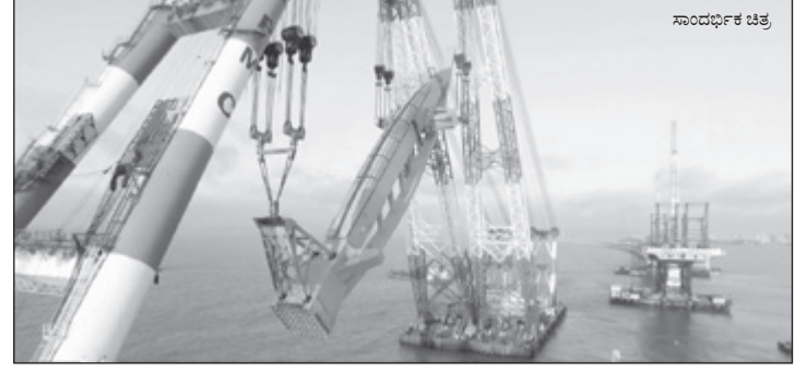
18 ಗೋಪುರಗಳನ್ನು ಒಳಗೊಂಡಿರುವ ಕೇಬಲ್ ಆಧಾರಿತ ಸೇತುವೆ...

ನಿರ್ಮಾಣಕ್ಕಾಗಿ ನಿರಂತರ ಹೋರಾಟ ಮಾಡುತ್ತಿದ್ದ ಈ ಭಾಗದ ಜನರ ಕನಸು ನನಸಾಗಿದೆ. ಕೇಂದ್ರ ಸರ್ಕಾರದ ಭಾರತ ಮಾರ್ಚ್ ಯೋಜನೆಯಡಿ ನಿರ್ಮಾಣಗೊಳ್ಳುತ್ತಿರುವ ಈ ಸಂಪರ್ಕ ಸೇತುವೆ 18 ಗೋಪುರಗಳನ್ನು ಒಳಗೊಂಡಿದೆ. ಭಾರತದ 2ನೇ ಅತಿ ದೊಡ್ಡ ಕೇಬಲ್ ಆಧಾರಿತ ಸೇತುವೆ ಎಂಬ ಹೆಗ್ಗಳಿಕೆಗೂ ಪಾತ್ರವಾಗಿರುವ ಸಿಂಗಧೂರು ಸಂಪರ್ಕ ಸೇತುವೆ ಮಲೆನಾಡಿನ ಪ್ರಕೃತಿಯ ಸೊಬಗನ್ನು ಮತ್ತಷ್ಟು ಹೆಚ್ಚಿಸಲಿದೆ.