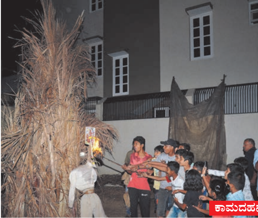
ಕಾಮದಹನ, ಬಣ್ಣ ಖರೀದಿ

ಸಂಪುಟ : 47 ಸಂಚಿಕೆ : 329 ☎ 254736 📠 91642 99999 RNI No: 27369/75, KA/SK/CTA-275/2021-2023. O/P @ J.D. Circle P.O. ಪುಟ : 6 ರೂ : 4.00 🌐 www.janathavani.com ✉ janathavani@mac.com