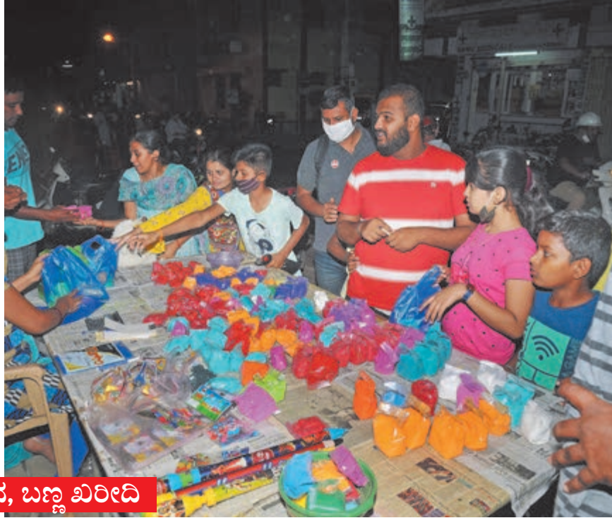
ದಾವಣಗೆರೆ ನಗರದ ವಿವಿಧ ಬಡಾವಣೆಗಳಲ್ಲಿ ಭಾನುವಾರ ರಾತ್ರಿ ಕಾಮದಹನ ನಡೆಸಲಾಯಿತು. ಸೋಮವಾರ ಹೋಳಿ ಹಬ್ಬದ ಅಂಗವಾಗಿ ಜನತೆ ಬಗ್ಗೆ ಬಗ್ಗೆಯ ಬಣ್ಣಗಳನ್ನು ಖರೀದಿಸಿದರು.