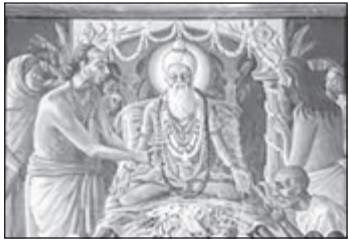
ಈ ಸಂದರ್ಭದಲ್ಲಿ ತಾತಯ್ಯನವರ ಪುತಿಮ ನಿರ್ಮಿಸಲು ಸರ್ಕಾರ ಗಮನ ಹರಿಸಬೇಕೆಂದು ಸುದ್ದಿಗೋಷ್ಠಿಯಲ್ಲಿ ಒತ್ತಾಯಿಸಿದರು. ರಾಜ್ಯದಲ್ಲಿ 40 ಲಕ್ಷ ಜನಸಂಖ್ಯೆ ಹೊಂದಿರುವ ಬಲಿಜ ಸಮಾಜಕ್ಕೆ ಪ್ರತ್ಯೇಕ ಅಭಿವೃದ್ಧಿ ನಿಗಮ, ಪ್ರಾಧಿಕಾರ ರಚನೆಯಾಗಿಲ್ಲ. ಗುರು ಪೀಠವಾಗಲೀ, ಶ್ರೀಗಳಾಗಲೀ ಇಲ್ಲ. ಸರ್ಕಾರ ದಾವಣಗೆರೆ-ಹರಿಹರ ಭಾಗದಲ್ಲಿ ಗುರುಪೀಠ ರಚನೆ ಹಿನ್ನೆಲೆಯಲ್ಲಿ ಸಮಾಜಕ್ಕೆ 5 ಎಕರೆ ಜಾಗ ನೀಡಬೇಕು ಎಂದು ಅವರು ಆಗ್ರಹಿಸಿದರು.