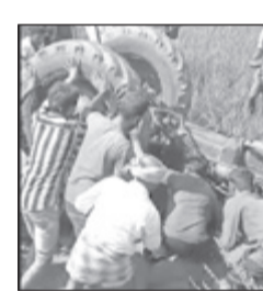
ದಾವಣಗೆರೆ, ಮಾ.26- ಚಿಲಿಸುತ್ತಿದ್ದ ಟ್ರ್ಯಾಕ್ಟರ್ ಚಾಲಕನು ನಿಯಂತ್ರಣ ತಪ್ಪಿ ಹೊಲದಲ್ಲಿ ಮಗುಚಿ ಬಿದ್ದ ಪರಿಣಾಮ ಅದರ ಅಡಿ ಸಿಲುಕಿದ್ದ ಚಾಲಕನೊಬ್ಬ