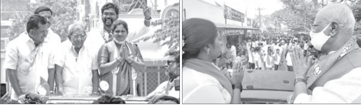
ಮಹಾನಗರ ಪಾಲಿಕೆ 20ನೇ ವಾರ್ಡ್‌ನಲ್ಲಿ ಶಾಸಕ ಶಾಮನೂರು ಶಿವಶಂಕರಪ್ಪ ಹಾಗೂ ಸಂಸದ ಜಿ.ಎಂ. ಸಿದ್ದೇಶ್ವರ ಅವರು ತಮ್ಮ ಪಕ್ಕದ ಅಭ್ಯರ್ಥಿಗಳ ಪರ ಚುನಾವಣಾ ಪ್ರಚಾರ ನಡೆಸಿದರು.