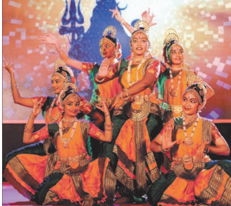
ದಾವಣಗೆರೆ ಶಿವಯೋಗಿ ಮಂದಿರದಲ್ಲಿ 'ಚಿರಂತನ' ದಿಂದ ನಡೆದ ಕಾರ್ಯಕ್ರಮದಲ್ಲಿನ ನೃತ್ಯ ಪ್ರದರ್ಶನ