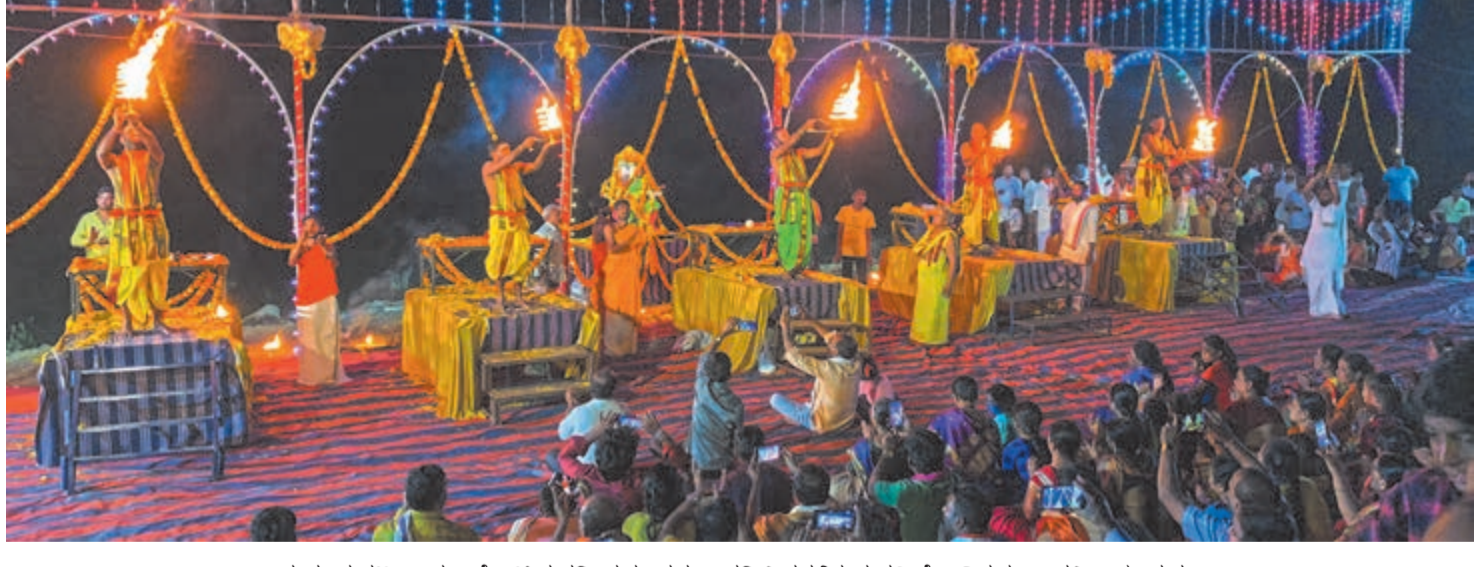
ಕುಮಾರ ಪಟ್ಟಣಂ ಪುಣ್ಯ ಕೋಟೆ ಮಠದಿಂದ ತುಂಗಭದ್ರಾ ನದಿ ತೀರದಲ್ಲಿರುವ ಹಮ್ಮಿಕೊಂಡಿದ್ದ ತುಂಗಾರತಿ ಕಾರ್ಯಕ್ರಮ