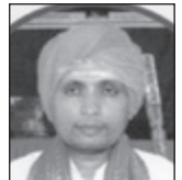
ಕಾಲ ನಡೆಸಿಕೊಂಡು ಬಂದರು. ಗದಗದಲ್ಲಿ ಅಂಧ ಮಕ್ಕಳ ಆಶ್ರಮ ಸ್ಥಾಪನೆಯಾದ