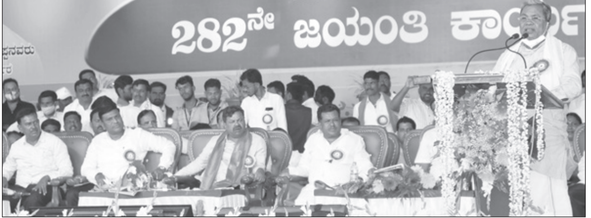
ನ್ಯಾಮತಿ ತಾಲ್ಲೂಕಿನ ಸೂರಗೊಂಡನ ಕೊಪ್ಪ ಭಾಯಗಾಡ್ ನ ಶ್ರೀ ಸಂತ ಸೇವಾಲಾಲ್ ಕ್ಷೇತ್ರದಲ್ಲಿ ನಡೆದ ಸಂತ ಸೇವಾಲಾಲ್ ಅವರ 282ನೇ ಜಯಂತೋತ್ಸವ ಕಾರ್ಯಕ್ರಮದಲ್ಲಿ ಮಾಜಿ ಮುಖ್ಯಮಂತ್ರಿ ಸಿದ್ದರಾಮಯ್ಯ ಮಾತನಾಡಿದರು.

(1ನೇ ಪುಟದಿಂದ) ಪುಣ್ಯ ಕ್ಷೇತ್ರ ಒಂದು ರೀತಿ ಎರಡನೇ ಧರ್ಮಸ್ಥಳದಂತೆ ಅಭಿವೃದ್ಧಿ ಹೊಂದುತ್ತಿದೆ ಎಂದರು.