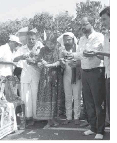
ಧಾರವಾಡದ ಇಟ್ಟಿಗಟ್ಟಿ ಬಳಿಯ ರಾಷ್ಟ್ರೀಯ ಹೆದ್ದಾರಿ ತಡೆದು ಮೃತ ಎಲ್ಲಾ 12 ಜನರ ಭಾವಚಿತ್ರಗಳಿಗೆ ಪೂಜೆ ಸಲ್ಲಿಸಿ, ಮೌನ ಪ್ರತಿಭಟನೆ ನಡೆಸುತ್ತಿರುವ ಕುಟುಂಬಸ್ಥರು ಮತ್ತು ಬಂಧುಗಳು ಹಾಗೂ ಸ್ನೇಹಿತರು.

- ಭಾವನಾತ್ಮಕ ಮತ್ತು ಅಕ್ಕೋಶಭರಿತವಾದ ಈ ಎರಡೂ ದೃಶ್ಯಗಳು ಕಂಡು ಬಂದಿದ್ದು, ಹುಬ್ಬಳ್ಳಿ - ಧಾರವಾಡ ರಾಷ್ಟ್ರೀಯ ಹೆದ್ದಾರಿಯಲ್ಲಿ ರುವ ಇಟ್ಟಿಗಟ್ಟಿ ಎಂಬ ಗ್ರಾಮದ ಬಳಿ. ಕಳೆದ 22 ದಿನಗಳ ಹಿಂದೆ ಜನವರಿ 15ರ ಬೆಳಿಗಿನ ಜಾವ ಇಟ್ಟಿಗಟ್ಟಿ ಸಮೀಪ ಸಂಭವಿಸಿದ ಭೀಕರ ರಸ್ತೆ ಅಪಘಾತದಲ್ಲಿ ಮಡಿದ ದಾವಣಗೆರೆಯ 10 ಮಹಿಳೆಯರೂ ಸೇರಿದಂತೆ ಒಟ್ಟು 12 ಜನರ ಕುಟುಂಬಸ್ಥರು ಭಾವಪೂರ್ಣ ಶ್ರದ್ಧಾಂಜಲಿ ಕಾರ್ಯಕ್ರಮದ ಮೂಲಕ ಶನಿವಾರ ಬೆಳಿಗ್ಗೆ ನಡೆಸಿದ ಮೌನ ಪ್ರತಿಭಟನೆಯ ಈ ದೃಶ್ಯ ಮನಸಿಡಿಯುವಂತಿತ್ತು.