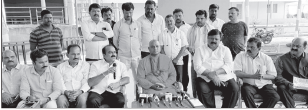
ಮೀಸಲಿರಿಸಿದ. ಅದೇ ರೀತಿ ಸಿದ್ಧರಾಮಯ್ಯ