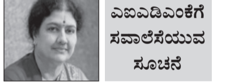
ಎಐಐಎಂಕೆಗೆ ಸವಾಲೆಸೆಯುವ ಸೂಚನೆ

ಬೆಂಗಳೂರು, ಒ. 31 - ಉಚ್ಚಾಟಿತ ಎಐಐಎಂಕೆ ನಾಯಕಿ ವಿ.ಕೆ.ಶಶಿಕಲಾ ಅವರು ಚೈಲು ಶಿಕ್ಷೆ ಪೂರೈಸಿದ ನಂತರ, ಕೊರೋನಾದಿಂದ ಚೇತರಿಸಿಕೊಂಡು ಆಸ್ಪತ್ರೆಯಿಂದ ಬಿಡುಗಡೆಯಾಗಿದ್ದಾರೆ. ಎಐಐಎಂಕೆ ದ್ವಜ ಇರುವ ಕಾರಿ ನಲ್ಲಿ ಪ್ರಯಾಣ ಮಾಡಿರುವ ಅವರು, ತಮಿಳುನಾಡಿನ ಆಡಳಿತಾರೂಢ ಪಕ್ಷದ ಚೊತೆ ಸಂಘರ್ಷಕ್ಕಿಳಿಯುವ ಸೂಚನೆ ನೀಡಿದ್ದಾರೆ. ಎಐಐಎಂಕೆಯಿಂದ ಉಚ್ಚಾಟನೆಗೊಂಡಿರುವ ಶಶಿಕಲಾ, ಪಕ್ಷದ ದ್ವಜ ಬಳಸುವುದಕ್ಕೆ ತೀವ್ರ ಆಕ್ಷೇಪ ವ್ಯಕ್ತಪಡಿಸಲಾಗಿದೆ. ಶಶಿಕಲ ಬಿಡುಗಡೆಯಾದರೂ ಅದು ಯಾವುದೇ ಪರಿಣಾಮ ಬೀರುವುದಿಲ್ಲ ಎಂದು ಎಐಐಎಂಕೆ ತಿಳಿಸಿದೆ. ಹಾಲಿ ಮುಖ್ಯಮಂತ್ರಿ ಕೆ. ಪಳನಿರಾಜು ಅವರೇ