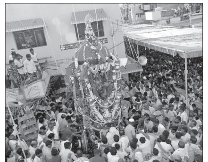
ಕೊಟ್ಟಿರಿನಲ್ಲಿ ಬನಶಂಕರಿ ದೇವಿ ರಥೋತ್ಸವ ಕೊಟ್ಟಿರಿನ ಕೌಲುಪೇಟೆ ಶ್ರೀ ಬನಶಂಕರಿ ದೇವಿಯ ರಥೋತ್ಸವವು ಗುರುವಾರ ಸಡಗರ - ಸಂಭ್ರಮದಿಂದ ಜರುಗಿತು. ಸಾವಿರಾರು ಭಕ್ತರು ರಥೋತ್ಸವದಲ್ಲಿ ಭಾಗವಹಿಸಿದ್ದರು.