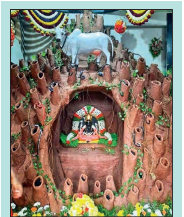
ಎಡೆಯೂರು ಸಿದ್ದಲಿಂಗೇಶ್ವರನಾಗಿ ದೊಡ್ಡಪೇಟೆ ವಿನಾಯಕ ಸ್ವಾಮಿ ದಾವಣಗೆರೆ ದೊಡ್ಡಪೇಟೆ ಶ್ರೀ ವಿನಾಯಕ ಸ್ವಾಮಿಯ ಕಡೇ ಕಾರ್ತಿಕ ಮಹೋತ್ಸವದ ಪ್ರಯುಕ್ತ ಶ್ರೀ ವಿನಾಯಕ ಸ್ವಾಮಿಗೆ ಶ್ರೀ ಎಡೆಯೂರು ಸಿದ್ದಲಿಂಗೇಶ್ವರರ ಅಲಂಕಾರ ಮಾಡಲಾಗಿತ್ತು.