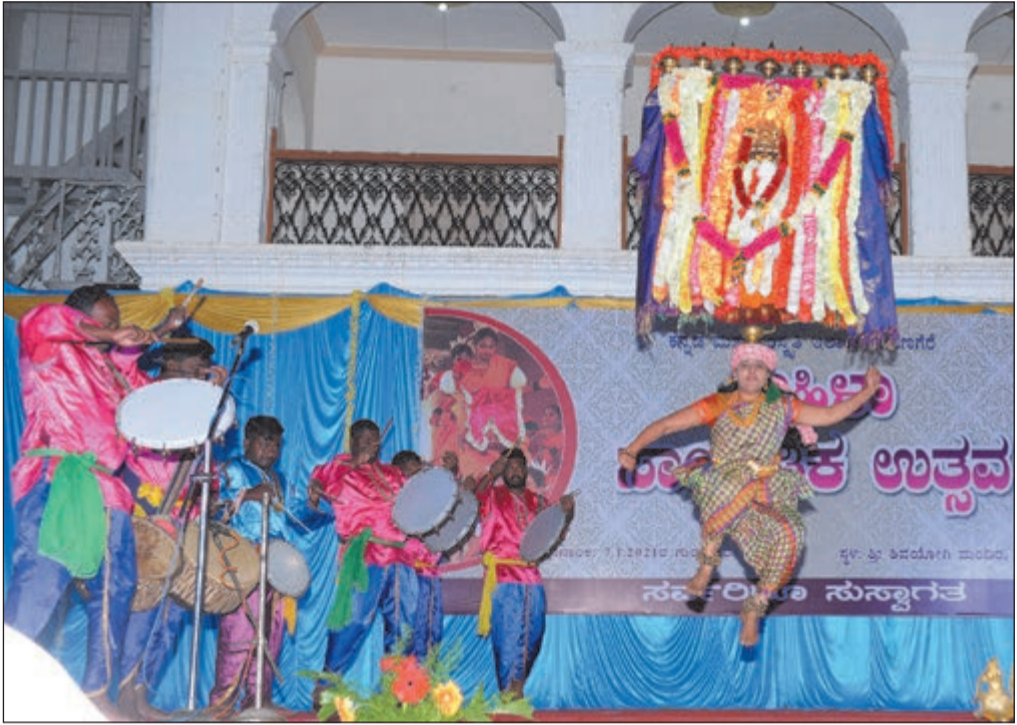
ಪೂಜಾ ಕುಣಿತ ಕನ್ನಡ ಮತ್ತು ಸಂಸ್ಕೃತಿ ಇಲಾಖೆ ವತಿಯಿಂದ ಗುರುವಾರ ಸಂಜೆ ದಾವಣಗೆರೆಯ ಶ್ರೀ ಶಿವಯೋಗಿ ಮಂದಿರದ ಆವರಣದಲ್ಲಿ ಏರ್ಪಡಿಸಿದ ಮಹಿಳಾ ಸಾಂಸ್ಕೃತಿಕ ಉತ್ಸವದಲ್ಲಿ ಪೂಜಾ ಕುಣಿತದ ದೃಶ್ಯ ಪ್ರೇಕ್ಷಕರನ್ನು ಹಿಡಿದಿಟ್ಟುಕೊಂಡಿತ್ತು.