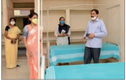
ಅಂಬುಲೆನ್ಸ್ ವ್ಯವಸ್ಥೆ, ಅಡ್ಡ ಪರಿಣಾಮವಾದಾಗ ಬಳಸುವ ಎ.ಇ.ಎಫ್.ಐ. ಕಿಟ್, ಆನ್‌ಲೈನ್ ನೋಂದಣಿ ವ್ಯವಸ್ಥೆಗಳ ಮೂಲಕ ತಾಲೀಮು ನಡೆಸಲಾಗುತ್ತದೆ ಎಂದವರು ಹೇಳಿದ್ದಾರೆ.

ದಾವಣಗೆರೆ, ಜ. 7 - ನಾಳೆ ಶುಕ್ರವಾರ ಬೆಳಿಗ್ಗೆ 10 ಗಂಟೆಯಿಂದ ಮಧ್ಯಾಹ್ನ 1.30 ರವರೆಗೆ ಜಿಲ್ಲೆಯ ಸಂಸ್ಥೆಗಳಲ್ಲಿ ಕೊರೊನಾ ಲಸಿಕೆ ತಾಲೀಮು ನಡೆಸಲಾಗುವುದು ಎಂದು ಜಿಲ್ಲಾಧಿಕಾರಿ ಮಹಾಂತೇಶ್ ಬೀಳಗಿ ತಿಳಿಸಿದರು. ತಮ್ಮ ಕಚೇರಿಯಲ್ಲಿ ಕರೆದಿದ್ದ ಪತ್ರಿಕಾಗೋಷ್ಠಿಯಲ್ಲಿ ಮಾತನಾಡಿದ ಅವರು, ನಗರದ ಚಿಗಟೇರಿ ಜಿಲ್ಲಾ ಆಸ್ಪತ್ರೆ, ಭಾಷನಗರದ ನಗರ ಆರೋಗ್ಯ ಕೇಂದ್ರ, ಎಸ್. ಎಸ್.ಐ.ಎಂ.ಎಸ್ ವೈದ್ಯಕೀಯ ಮಹಾವಿದ್ಯಾಲಯ, ಹೊನ್ನಾಳಿಯ ಸಾರ್ವಜನಿಕ ಆಸ್ಪತ್ರೆ, ಚನ್ನಗಿರಿ ತಾಲ್ಲೂಕು ಸಂಕೇತನೂರಿನ ಸಮುದಾಯ ಆರೋಗ್ಯ ಕೇಂದ್ರ ಹಾಗೂ ಹರಿಹರ ತಾಲ್ಲೂಕಿನ ಕೊಂಡವಿಲ್ಲೆಯ ಪ್ರಾಥಮಿಕ ಆರೋಗ್ಯ ಕೇಂದ್ರಗಳಲ್ಲಿ ಲಸಿಕಾ ತಾಲೀಮು ನಡೆಸಲಾಗುವುದು ಎಂದವರು ತಿಳಿಸಿದ್ದಾರೆ. ವೈದ್ಯರು ವೈದ್ಯಕೀಯ ಸಿಬ್ಬಂದಿ, ಈಗಾಗಲೇ 17,651 (4ನೇ ಪುಟಕ್ಕೆ)