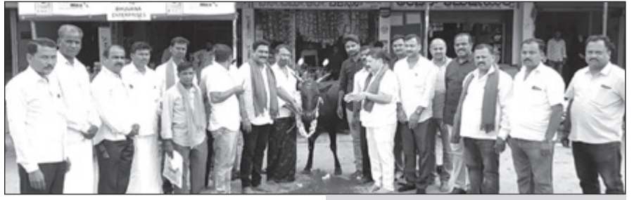
ಹರಿಹರ, ಜ.7- ಇಲ್ಲಿನ ಬಿಜೆಪಿ ಕಚೇರಿಯಲ್ಲಿ ಇಂದು ನಡೆದ ಹರಿಹರ ಗ್ರಾಮಾಂತರ ರೈತ ಮೋರ್ಚಾ ಕಾರ್ಯಕಾರಿಣಿ ಸಭೆಯನ್ನು ಗೋ ಪೂಜೆ ಮಾಡುವುದರ ಮೂಲಕ ಆರಂಭಿಸಲಾಯಿತು.