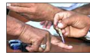
ಪೂರ್ಣಗೊಳಿಸಲು ರಾಜ್ಯ ಚುನಾವಣಾ ಆಯೋಗ ಸಕಲ ಸಿದ್ಧತೆ ಮಾಡಿಕೊಂಡಿದೆ. ಸಂಕಷ್ಟದಲ್ಲಿ ಚುನಾವಣೆ ನಡೆಸಲು ಸರ್ಕಾರ ಮತ್ತು ರಾಜಕೀಯ ಪಕ್ಷಗಳಿಗೆ ಆಸಕ್ತಿ ಇಲ್ಲದಿದ್ದರೂ, ರಾಜ್ಯ ಹೈ ಕೋರ್ಟ್ ಕೆಳ ಹಂತದ ಅಧಿಕಾರ ಕೇಂದ್ರಗಳಿಗೆ ಚುನಾವಣೆ ನಡೆಸಿ, ಅವರಿಗೆ ಅಧಿಕಾರ ನೀಡಿ, ಇಂತಿಷ್ಟು ಸಮಯ ದಲ್ಲೇ ಚುನಾವಣಾ ಪ್ರಕ್ರಿಯೆ ಪೂರ್ಣಗೊಳಿಸಬೇಕೆಂದು ರಾಜ್ಯ ಚುನಾವಣಾ

ಬೆಂಗಳೂರು, ಡಿ. 26 - ಕೊರೋನಾ ಭೀತಿಯಲ್ಲೇ ಗ್ರಾಮ ಪಂಚಾಯಿತಿಗಳಿಗೆ ನಾಳೆ ಸಂಜೆ ವೇಳೆಗೆ ಚುನಾವಣಾ ಮತದಾನ ಅಂತ್ಯಗೊಳ್ಳಲಿದೆ. ಕಳೆದ 22 ರಂದು ಶೇ. 50 ಕ್ಷೇತ್ರಗಳಿಗೆ ಮೊದಲ ಹಂತದಲ್ಲಿ ಚುನಾವಣೆ ನಡೆದರೆ, ಎರಡನೇ ಹಂತದಲ್ಲಿ 109 ತಾಲ್ಲೂಕುಗಳ 2,709 ಪಂಚಾಯಿತಿಗಳಿಗೆ ಚುನಾವಣೆ ನಡೆಯಲಿದೆ. ಕೊರೋನಾ ಸಂಕಷ್ಟದ ನಡುವೆ ಬಹುಶಃ ವಿಧಾನಸಭಾ ಚುನಾವಣೆ ನಡೆಸುವ ಸಾರ್ವತ್ರಿಕವಾಗಿ ನಡೆಯುತ್ತಿರುವ ದೊಡ್ಡ ಚುನಾವಣೆ ಇದಾಗಿದೆ. ಮೊದಲ ಹಂತದಲ್ಲಿ ಎಲ್ಲೆಯೂ ಸಂಕಷ್ಟಕ್ಕೆ ಸಿಲುಕಿಲ್ಲ. ಎರಡನೇ ಹಂತದಲ್ಲಿ ಚುನಾವಣೆಯನ್ನು ಶಾಂತಿಯಿಂದ