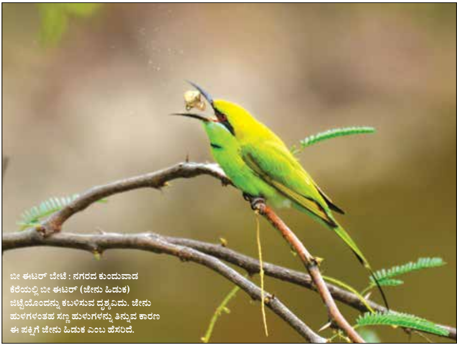
ಬೀಳುಕು ಬೇಟೆ : ಪಗರದ ಕುಂದುವಾಡ ಕೆಲವು ಬೀಳುಕು (ಬೇಟೆ ಒಡುಕು) ಬೀಳುಕುಗಳನ್ನು ಕುಳಿಸುವ ದೃಶ್ಯವನ್ನು. ಬೇಟೆ ಮುಳುಗುವ ಸಣ್ಣ ಮುಳುಗನ್ನು ತಿನ್ನುವ ಕಾರಣ ಈ ಪಕ್ಷಿಗು ಬೇಟೆ ಒಡುಕು ಎಂಬ ಹೆಸರಿದೆ.